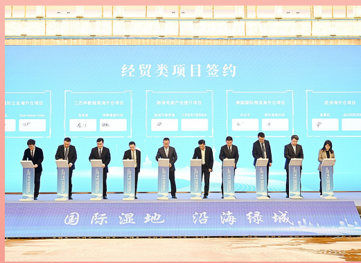
盐城投资环境说明会暨丹顶鹤黄海湿地旅游节

撑。实施跨境电商高质量发展三年行动,高规格组织全市跨境电商培训会,分县(市、区)举办跨境电商政策巡讲和专项培训,累计培训超5000人次。成立盐城跨境电商市场产教联合体,盐城幼儿师范跨境电商专业首届招收92名新生。“9610简化申报模式”全省率先实现异地通关便捷化。打造跨境电商特色产业。促进“跨境电商+产业带”融合发展,与中国制造网、阿里国际站等签订战略合作协议,带动汽车配件、家纺等优势产业带产品抱团出海。依托市跨境电商产业园建立地方产业带展示选品中心,提供产品展示和交易撮合一站式服务。培育发展市级跨境电商知名品牌3个,“盐城制造”国际竞争力进一步提升。