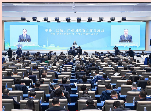
中韩(盐城)产业园经贸合作交流会

全球”,进出口规模居全省前列。海外仓加速布局,累计建成玉南国际、金丽达等各类海外仓20个,面积16.8万平方米,覆盖美国、韩国、东盟等10个国家和地区。抢抓政策机遇,全市新增二手车出口备案企业15家,二手车出口实现“零”的突破。新政策举措集成发力。制定新一轮促进外贸高质量发展的若干措施,精心组织实施年度贸易促进计划,全方位组织开展RCEP、服务贸易和知识产权专项培训。累计使用中央、省、市商务发展引导资金2686万元,惠及外贸企业超200家。