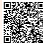
扫码观看数字人播报

这一年,全市商务人一着不让抓好经济运行,规模稳健向上,结构持续优化;一马当先发力招商引资,体系更加健全,项目持续突破;一以贯之推进改革赋能,提升载体能级,厚植营商沃土;一心一意增进民生福祉,完善商业布局,消费供需两旺。回顾商务人一年来的奋斗之路,有一些闪亮的坐标让人记忆深刻。