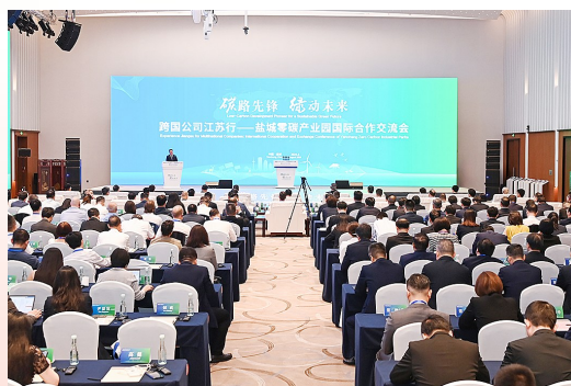
跨国公司江苏行——盐城零碳产业园国际合作交流会

冬暖盐城”四季主题,开展系列消费促销活动超2000场,打造“一县一主题”特色品牌,推出“一县一桌菜”盐城地标美食。消费政策加码升温。“以旧换新”成效显著,推动汽车换“能”、家电换“智”、家装厨卫“焕新”,全市汽车报废更新、置换更新补贴申请分别达9553辆和13787辆、家电销售22.56万件、电动自行车换购2.9万辆、家装家居改造1.29万单,全市累计使用资金5.51亿元,直接拉动消费39亿元,资金审核效率和资金使用进度全省排名靠前。