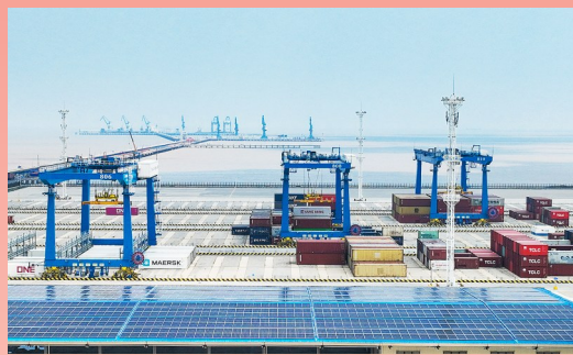
盐城港大丰港区自动化集装箱堆场