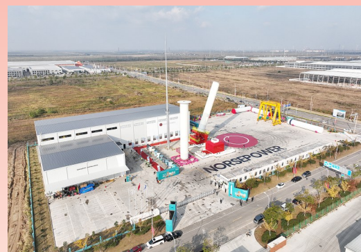
挪世航飞船科技(盐城)有限公司

开放专题推介会、中韩(盐城)产业园经贸合作交流会等高层次活动20场,组织赴韩国、日本、丹麦等国家开展“走进跨国公司总部”活动。联合省商务厅成功举办跨国公司江苏行——盐城零碳产业园国际合作交流会,25家世界500强企业、50家跨国公司、60家绿色低碳行业领军企业齐聚盐城,共谋绿色合作新路径。绿电招商成效好。3个零碳产业园全部实现可溯源绿电接入,全年新签约海洋算力中心、海辰储能等绿色低碳产业类项目超200个。