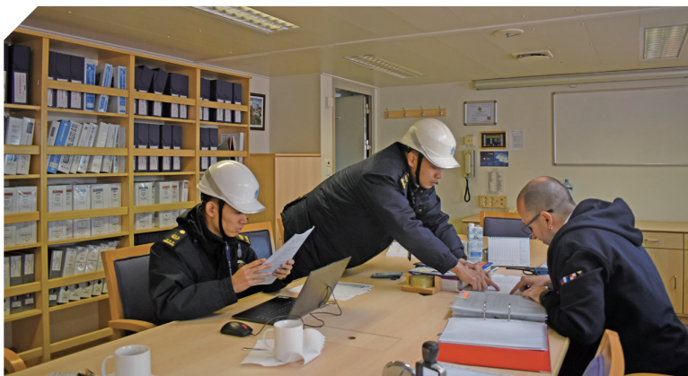
海事执法人员登轮对“瓦伦西亚”轮开展安全检查

据介绍,“套泊热接”作业是指为提升船舶靠泊作业效率,在A船作业完成离泊后,B船立刻接靠,一出一进“无缝衔接”,最大限度节省船舶在港待泊时间。目前,滨海港只有一个LNG泊位,同时受水深条件的限制,以往都是A船离泊后,B船需要等待合适时机再乘潮进港,此作业模式可将原先15个小时左右的待港时间压缩至3小时左右,大幅减少船舶待港时间和码头泊位空泊时间,也为货主节约了物流成本。中海油江苏LNG接收站是目前国内最大的LNG储备基地接收站,自2022年9月26日投产以来,已累计接卸92艘次LNG运输船舶,接卸总重量达590万吨,折合天然气约36亿立方米,为保障华东地区清洁能源安全供应和绿色低碳发展作出巨大贡献。预计整个2025年冬季,滨海港将接卸约6亿立方米天然气,为人民群众温暖过冬、企业正常生产、经济社会安全稳定运行提供坚强有力的服务保障。