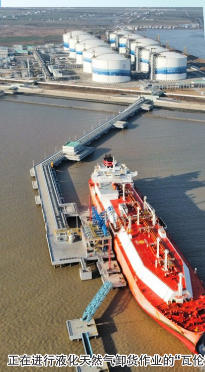
正在进行液化天然气卸货作业的“瓦伦西亚”轮