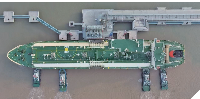
正在靠泊滨海港LNG码头的“新高点”轮