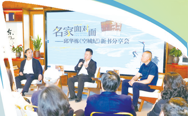
2024年10月,邱华栋《空城纪》分享会在潮间带艺术村举行。