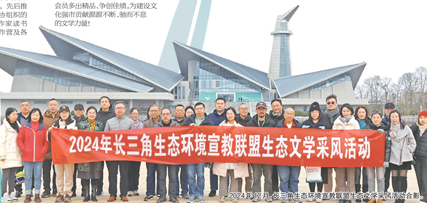
2024年12月,长三角生态环境宣教联盟生态文学采风活动合影。