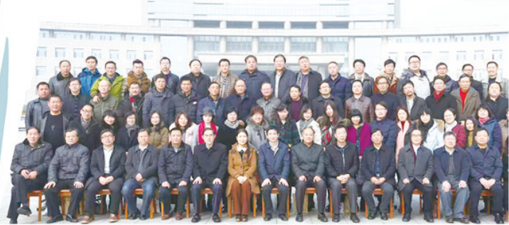
2018年1月,市作协第五次会员代表大会合影。