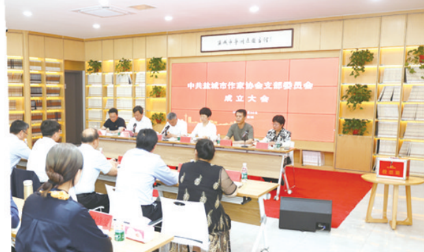
2024年5月,市作协召开党支部成立大会。