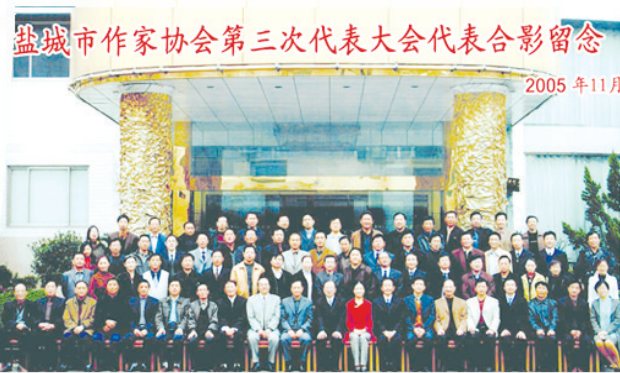
2005年11月,市作协第三次会员代表大会合影。