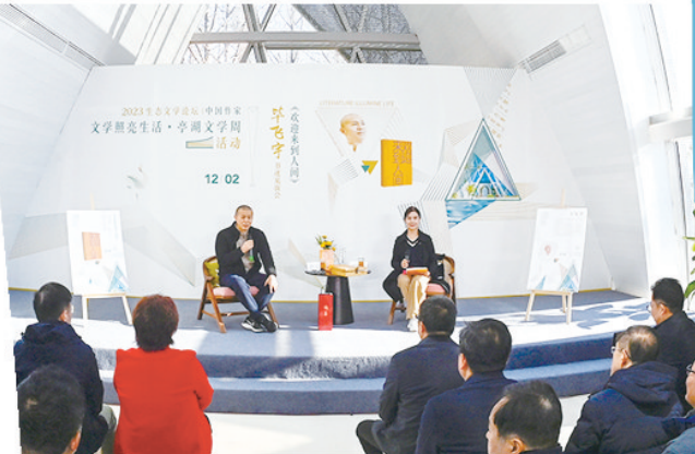
2023年12月,毕飞宇书迷见面会在鹤汀云栖·潮间带文学村举行。