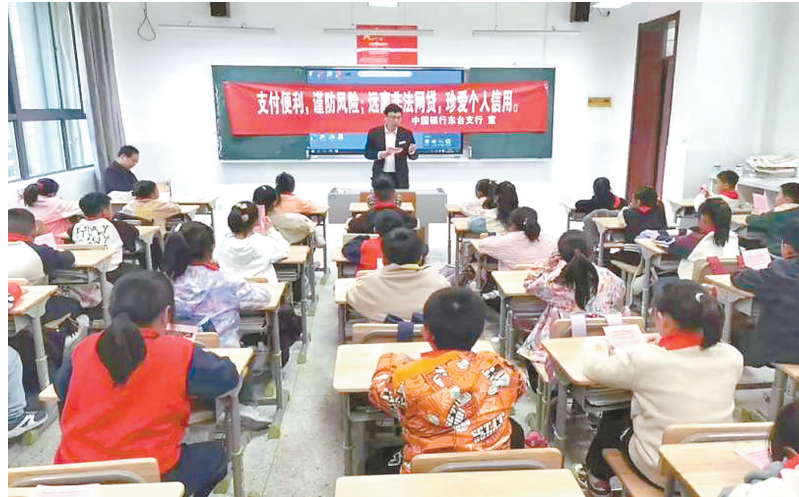
走进校园开展金融知识宣传活动

本报讯(罗慧)为不断践行金融工作的政治性、人民性,深入贯彻支付为民理念,倡导支付便利、保障支付安全,切实提升消费者风险防范能力和意识,进一步打造常态化教育宣传品牌,中国银行盐城分行组织辖内各机构积极开展“支付便利 谨防风险”专项教育宣传活动。