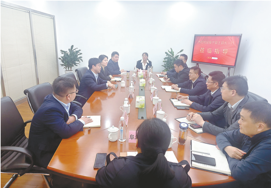
召开政银企交流座谈会

为畅通政银企对接渠道,助力辖区企业健康快速发展,今年11月,该行积极和阜宁县沟通对接,共同召开政银企座谈会,辖区多家企业代表参加会议。通过搭建政银企互动平台这一方式,三