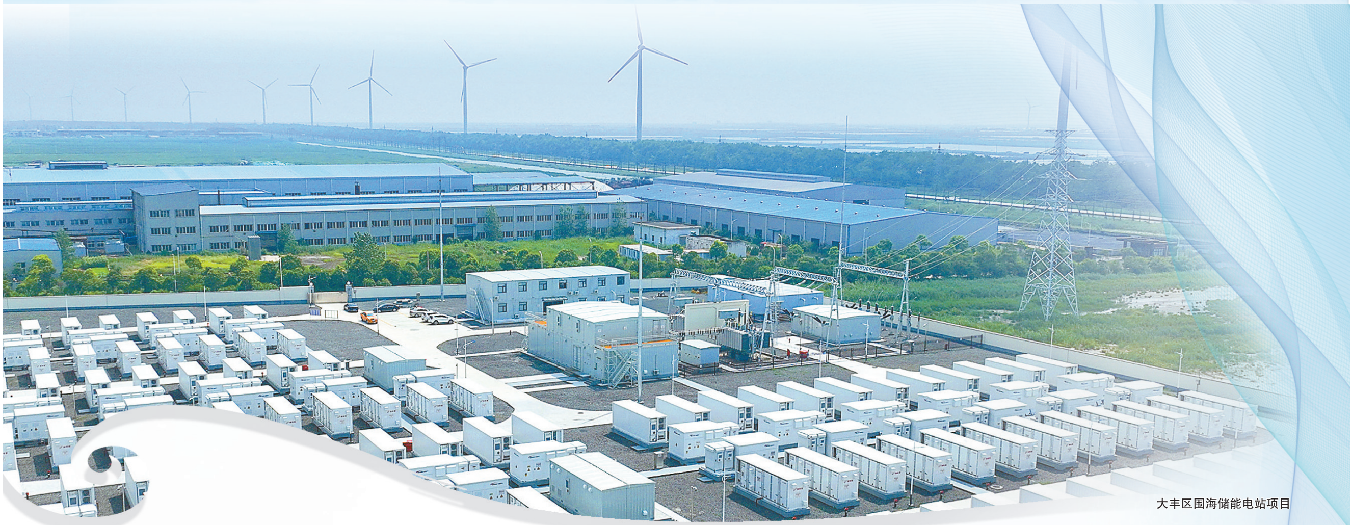
大丰区围海储能电站项目