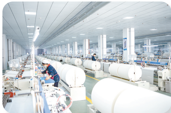
在盐城市纺织染整产业园的江苏沙印集团气流纺织车间里,工人娴熟地操作设备。