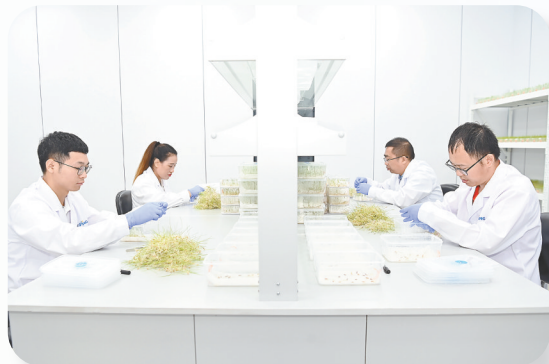
在建湖县隆平种业创业创新基地,科研人员正在筛选水稻种苗。

依托得天独厚的“风光”资源,我市牢牢把握高质量发展这个首要任务,坚持把新能源产业作为战略性新兴产业重点打造,积极抢抓发展机遇,持续优化能源结构,不断强链补链延链,全力推进产业智能化、高端化、绿色化发展,产业规模和开发规模实现“两个翻番”和“两个破千”历史性跨越。