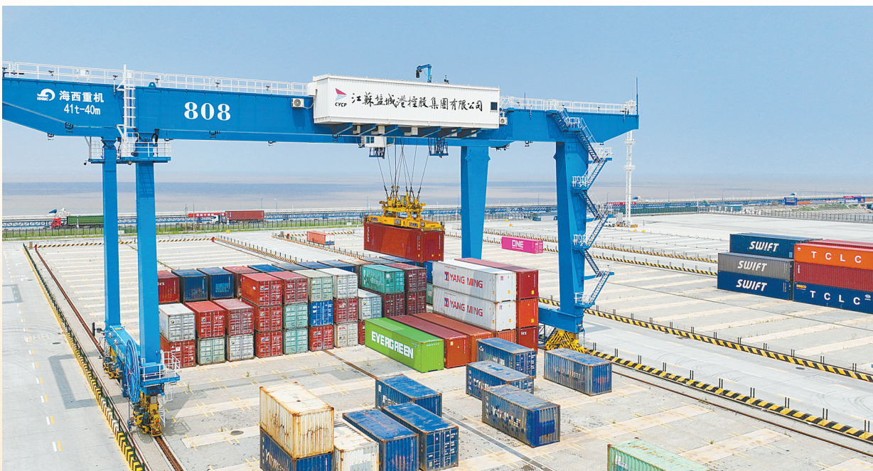
盐城港大丰港区的集装箱堆场,自动化无人轨道吊正在作业。