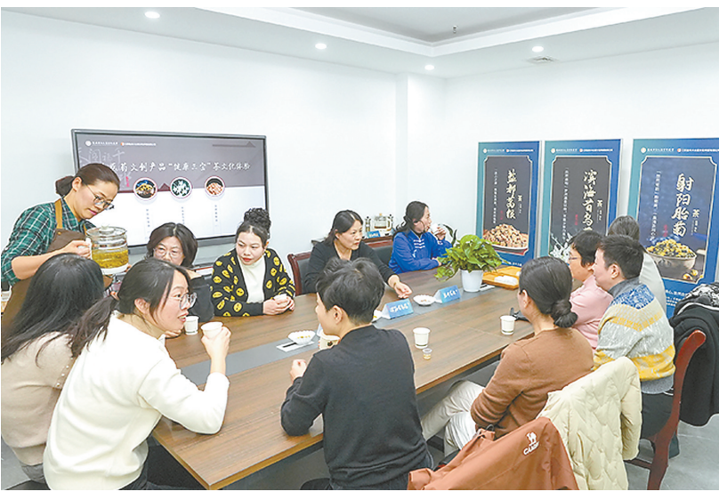
“健康三宝”茶文化体验现场

大家纷纷表示,工作节奏越来越快,年轻人越来越关注自身健康,对中医养生也热情高涨。工作之余到会客厅适时休息放松,来一杯“健康三宝”,工作中又增添了一份“小确幸”。“健康三宝”让中医药文化与潮流共舞,也在群众的心中持续“升温”,持续“沸腾”。未来,“健康三宝”将借助优质行业资源,讲好品牌故事,不断“解锁”更多场景,“拿捏”流量密码,让更多的人了解盐城地域文化,感受传统中医药的魅力。