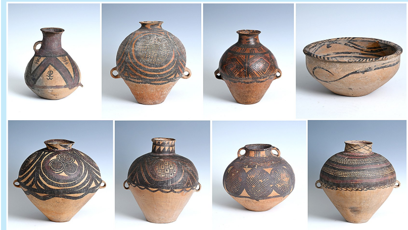
意大利返还中国的新石器时代马家窑彩陶器(11月5日摄,拼版照片)。

新华社北京11月9日电 (记者 施雨岑)记者11月9日从国家文物局获悉,56件流失文物艺术品近日从意大利回归祖国怀抱。