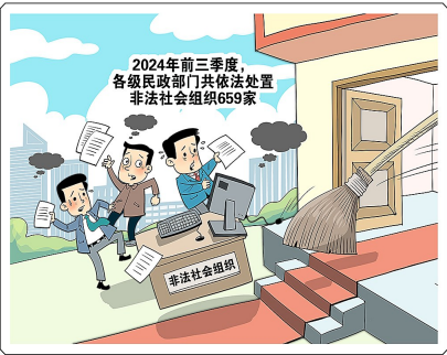
依法处置