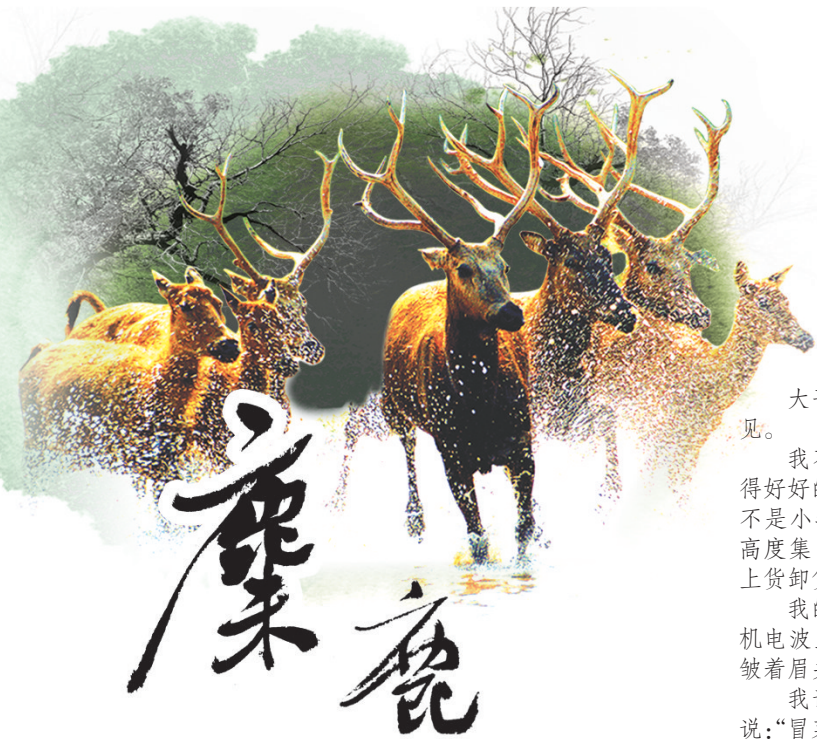
刊头摄影:杨国美 题字:赵守阳