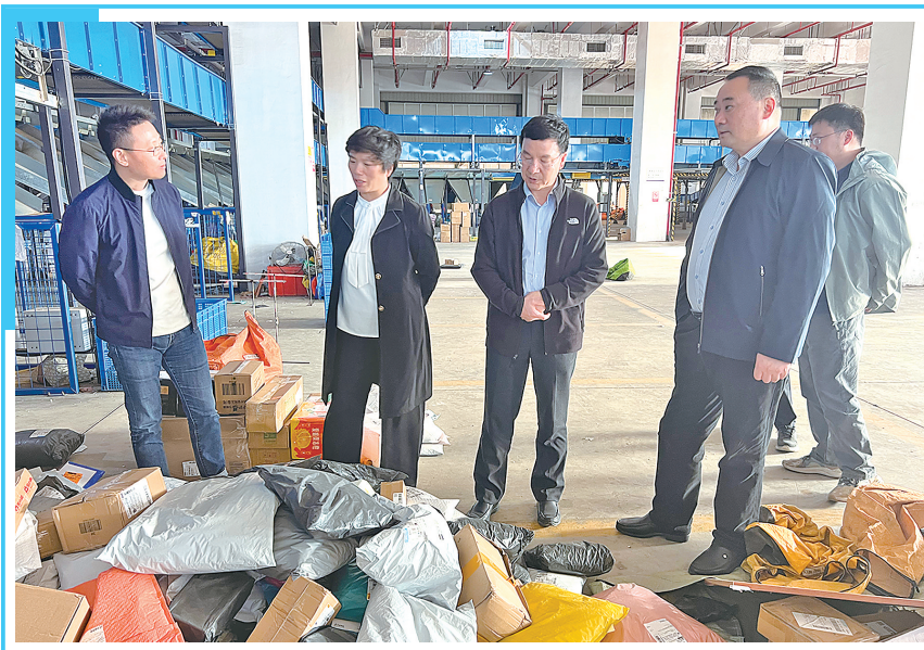
10月30日,江苏省邮政管理局调研组一行赴大丰区海博智能仓储物流中心调研指导快递共配工作,实地参观了快递共同配送处理场所,并深入详细了解快递共配模式运行情况。下一步,大丰区邮政局将继续完善工作措施,帮助企业解决实际困难,为实现“快递进村”打下坚实的基础。

此次比赛,彰显了盐城路灯光超精湛的技艺和团结协作的风貌,我市将持续树立“至诚至精、创新致远”的“匠心”精神,推动城市照明行业在“比”中赢对手,在“学”中树榜样,在“赶”中有目标,在“超”中找方向,从而推动全市照明行业职工专业技能水平的不断提升,为我市城市照明行业高质量发展提供坚强人才支撑。