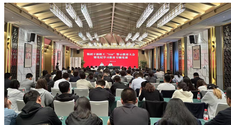
“510”警示教育大会暨党纪学习教育专题党课

党旗引领风帆劲,实干笃行勇担当。世纪新城集团紧跟党旗所指,聚焦发展之要,始终坚持党的领导和完善公司治理统一起来,高质量党建和高质量发展互动起来,将党的领导嵌入公司治理各环节、各业务板块,助推“清廉国企”建设走深走实。