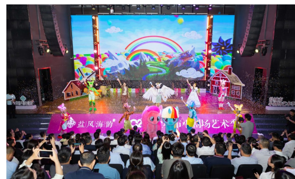
“盐风海韵”2024盐城市小剧场艺术季,东大门剧场《东之梦》首演

今年以来,世纪新城集团坚持以文塑旅、以旅彰文,强化运营思维,树立精品意识,聚焦多元业态,高水平谋划、高标准建设文旅产业项目,推动集团文旅产业高质量发展再上新台阶。截至目前,营收同比增长38%,运营成本同比去年上浮15%,累计接待游客约160万人次。