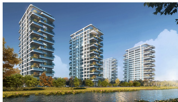
地产四代住宅(效果图)

印象花园等“保交楼”项目,正按照交付计划有序推进,确保相关楼盘按照时间节点交付。