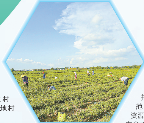
周庄村菊花种植基地村民在拔草

“村干部带货,有效发挥了农村党员干部的示范引领作用,对推动乡村全面振兴有着积极意义。”界牌镇党委书记吴宝庆表示,下一步,该镇将坚持以基层党组织为纽带,统筹整合各方力量,将资金、技术、农产品和市场有机整合起来,充分调动群众的积极性、主动性、参与性,努力形成村村抱团发展、村企联合共赢、群众共同致富的格局。