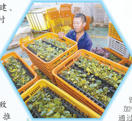
盐城悦悦农业有限公司工作人员搬运西兰花苗

“强村富民”是全面推进乡村振兴的落脚点,也是高质量实施乡村振兴战略的路径。近年来,滨海县界牌镇积极响应上级号召,深入实施“一村一策”,通过发展手工经济、村企联建、特色种植、村办劳务公司等多种模式,不断壮大村集体经济,带动老百姓增收致富,为全面推进乡村振兴夯实基础。