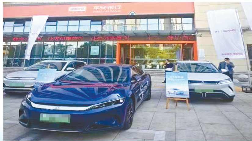
平安银行联合汽车厂商举办新车展示试驾活动

招商银行、浦发银行等机构与以金鹰、悦达889、爱琴海为代表的城市商圈商贸企业开展促销优惠活动,焕发舌尖美味、休闲运动、国货潮牌等各类消费热潮;南京银行盐城分行开展“听蝉鸣夏 鑫生喜悦”直播、主题内购会等活动,打造沉浸式消费场景,触达客户超万人;兴业银行盐城分行联合烧烤店、大排档等商户开展“龙虾节”活动,依托“兴业生活”App发放满减券促进餐饮消费,推动夜间经济发展与“食”俱进;江苏银行盐城分行联合周黑鸭、吃货码头等轻餐饮商户开展“717吃货节”活动,推出信用卡7折吃轻餐饮优惠,活动期间累计促成消费1.74万元;民生银行盐城分行推出“民生苏韵”城市主题卡,加强与苏果超市、麦当劳、来伊份等零售商户合作,通过云闪付App发放银行卡消费券,激发消费活力。