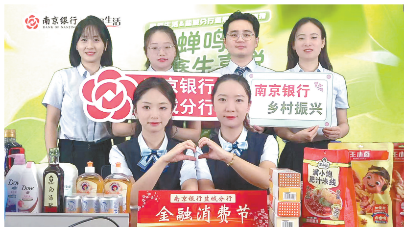
南京银行盐城分行开展“听蝉鸣夏 鑫生喜悦”直播活动