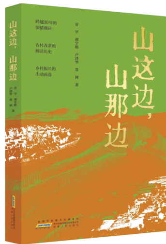
《山这边,山那边》 劳罕、邢宇皓、卢泽华、常河著 安徽人民出版社