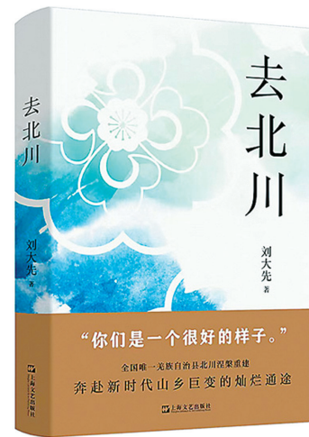
《去北川》 刘大先著 上海文艺出版社