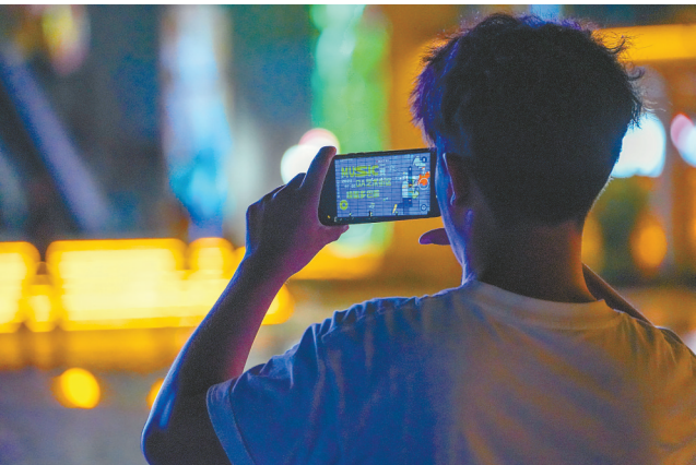
游客在D·A艺术街区拍摄音乐演出。