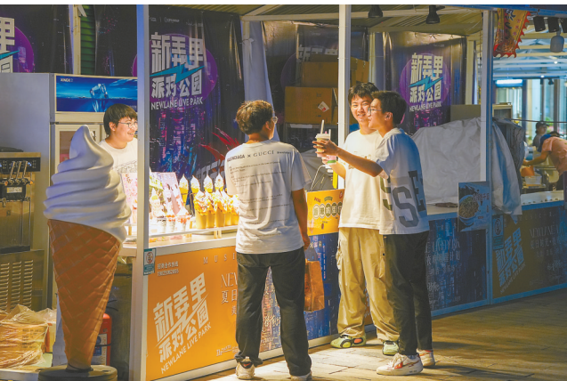
游客在新弄里派对公园品尝美食。

音乐之所以能够吸引并凝聚年轻人的心,除了其本身的魅力,更在于它所承载的文化内涵和情感共鸣。在盐城特色文化街区夏季嘉年华活动中,音乐成为连接过去与现在、传统与现代的桥梁。