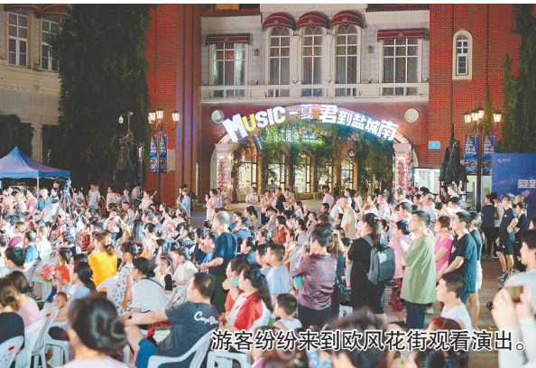
游客纷纷来到欧风花街观看演出。

此外,活动还安排了多条城市探索线路,吸引游客在夜晚游览盐城的美景。从古老的街巷到现代的建筑,从繁华的商业区到宁静的河畔,这些线路充分展示了盐城的多元面貌。