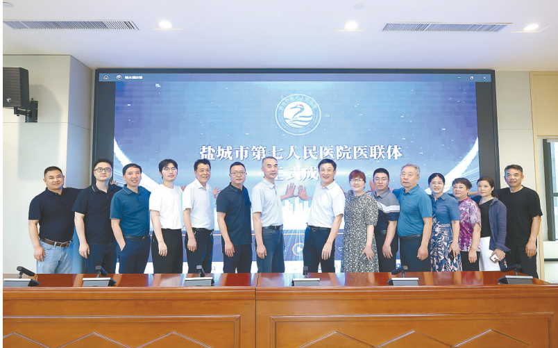
签约现场

“市七院专科特色明显,有不可替代性。我们盐海医院门诊每天都有部分病人经过检查,需要到三级医院救治,能够成为市七院医联体的一员,是我们期待已久的。”盐城盐海医