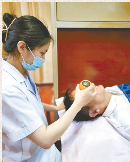
治未病科特色项目火龙罐

一排房间,几十张床,躺满了前来艾灸、推拿、拔罐、刮痧的人,其中不乏年轻的身影,甚至还有小朋友背着木匣子冒着