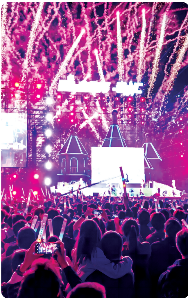
荷兰花海“只有爱音乐节”

近年来,盐城积极寻找发展繁荣“夜经济”着力点,培育多业态、多领域的夜间消费场景,构建起特色鲜明、体验丰富、业态多元的夏日活力“夜盐城”。立足端午、暑期、中秋、国庆等消费旺季,丰富夜购、夜食、夜游、夜娱等消费业态,打造一批兼具时尚活力和烟火气息的夜间经济地标;运用社交媒体、短视频平台、直播电商等新兴渠道,开展形式多样的宣传活动,推介特色“夜经济”打卡地和产品,吸引消费者线下体验;探索“夜经济”与文化、旅游、体育、音乐等产业的融合发展路径,推出符合市场需求和消费者喜好的产品,推动“夜经济”持续健康发展。