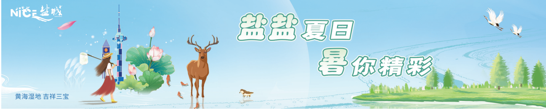
黄海湿地 吉祥三宝