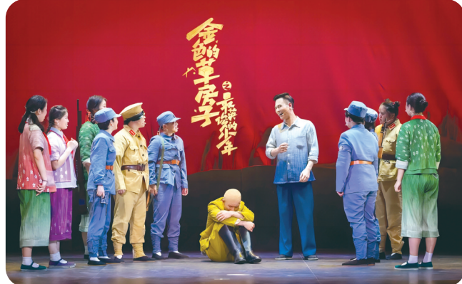
草房子《金色的草房子之最英俊的少年》