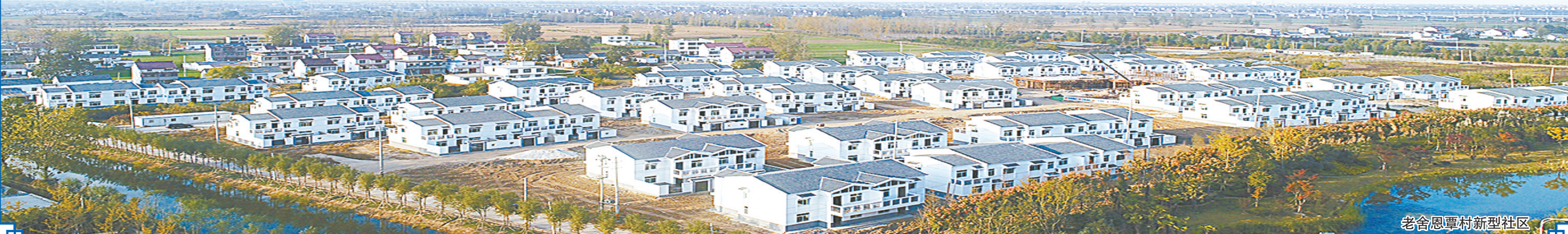
老舍恩里村新型社区