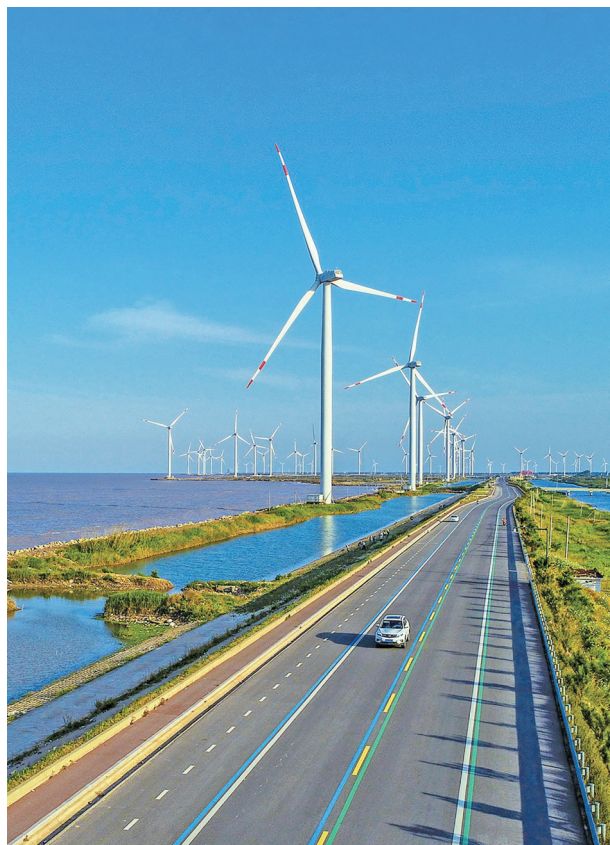
滨海县海岸线生态修复——临海公路

有力保障新增建设用地。积极组织土地报批,严格按照法律法规及省、市要求,严格用地报批审查,提高用地报批质量。已取得省政府批复16个,面积1049.34亩。使用林地手续已获得省批复项目5个。 提高土地利用效率。坚持将“三项清理”工作作为拓展发展空间、提升项目要素保障的一项重要工作,全面开展排查摸底,精准实施分类处置,取得了阶段性工作成效。今年全县处置闲置土地3宗136.5亩。