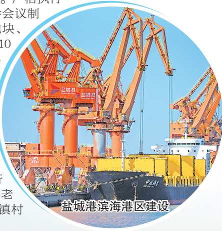
盐城港滨海港区建设

加强镇村规划实施管理。进一步优化镇村空间布局,指导镇村根据产业发展、全域综合整治、美丽乡村建设等工作需求,将村庄进行分类发展,指导部分镇村新老村庄融合发展,进一步提升镇村人居环境。