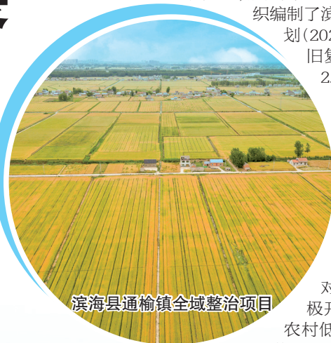
滨海县通榆镇全域整治项目

扎实推进增减挂钩工作。加大对农村存量建设用地的盘活力度,积极开展宅基地有偿退出,最大限度释放农村低效闲置土地资源;开展城乡建设用地增减挂钩入库立项工作,全县共入库44个项目,1983个地块,计划新增农用地1823.6亩,新增耕地1772.9亩。目前,项目已通过省整理中心预检,正在进行公示和听证,计划在6月底前完成市级立项。