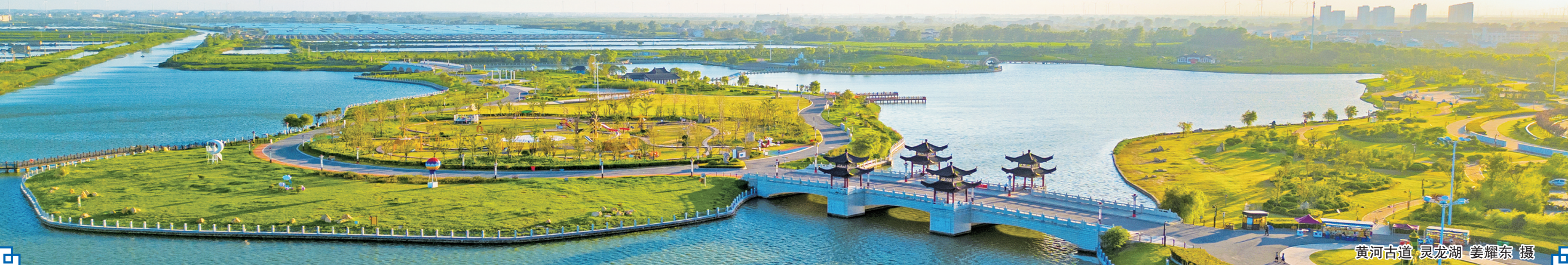
黄河古道·灵龙湖

营造一流不动产登记营商环境。创新项目建设全周期登记服务,全面开展工业企业首次登记“零材料”办理。创新实施“交海即发证”+海域使用权分层登记工作,助力该县海洋经济发展,探索出服务于海洋经济的不动产登记新举措。完成“零材料”交地(海)即发证2宗,交地面积963.94亩。为全县工业企业办理分层分幢登记11宗90本证书,为企业融资1.43亿元,进一步盘活存量资产。