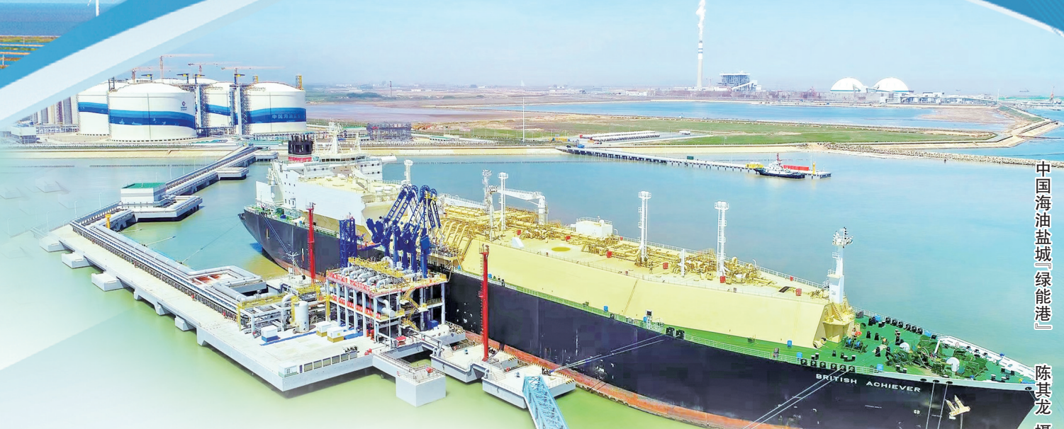
中国海油盐城“绿能港”