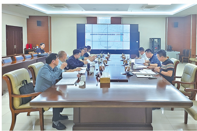
镇村布局优化规划

亮点纷呈,捷报频传。今年以来,阜宁县自然资源和规划局全面贯彻落实党中央和省决策部署,深入学习贯彻市委八届七次全会精神,紧紧围绕县委、县政府中心工作,在服务发展中保护资源,在资源保护中保障发展,为“勇当发展新质生产力重要阵地‘破路先锋’”作出新的更大贡献。