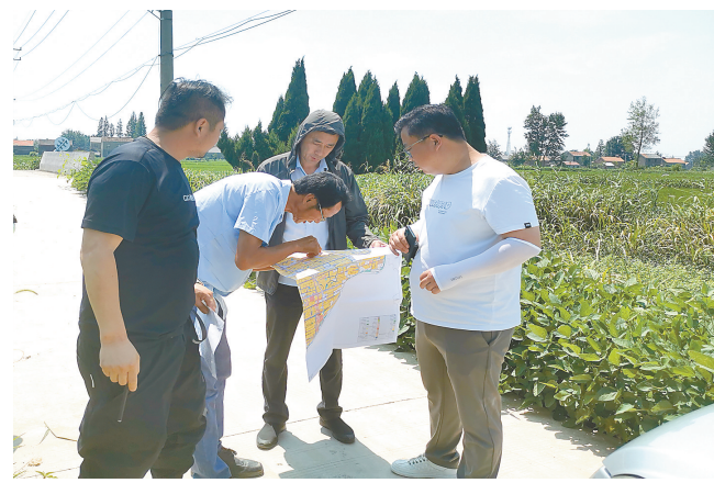
摸排耕地占补平衡后备资源

积极推进城乡建设用地增减挂钩工作。 通过完善奖补政策,建立负面清单,充分挖掘拆迁复垦潜力,加大对零散、破旧房屋及危房的拆迁复垦力度,全力推动城乡建设用地增减挂钩工作落地生效。今年上半年拟入库增减挂钩项目12个,面积599.11亩。