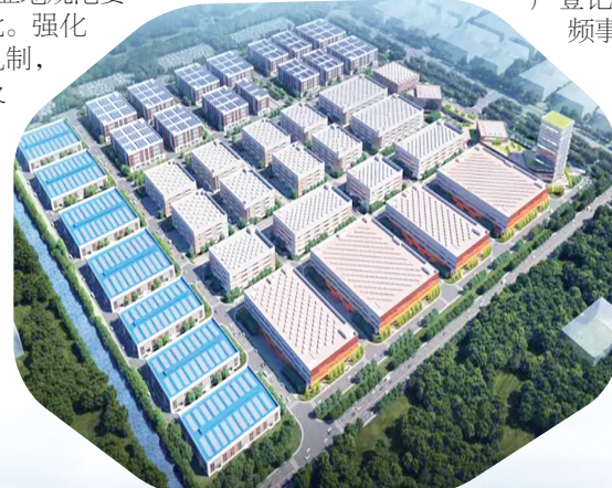
阜宁开发区电子信息产业园

用地审批质效提升。 按照征地区域规范要求,合理确定时间节点,套搭推进,并联审批。强化涉及相关征地区域的通力协作,形成联动机制,专人跟踪督导,每周通报征地区中问题,及时协调解决,形成工作合力,缩短报地周期。林地落界全面优化。完成省下达的5.4万亩林地、1.62万亩公益林任务,保证该县林地落界科学合理,为经济社会发展提供支持。