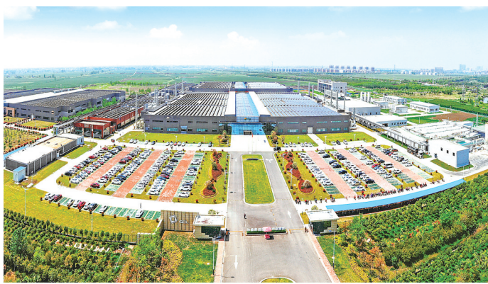
协鑫新能源产业园

前期工作超前谋划。 推进《阜宁县国土空间总体规划(2021-2035年)》数据库建立,做好镇村布局规划优化调整,优化城镇开发边界,推进村庄规划编制,加快编制18个片区、涉及总面积6520亩的成片开发方案,应编尽编,为用地报批提供支撑。