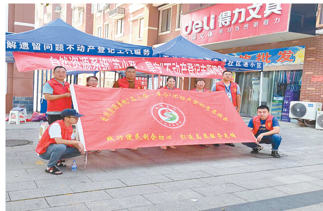
不动产登记志愿服务活动

降成本增活力优环境。 今年以来,阜宁县自然资源和规划局坚持主动服务惠民生,围绕企业群众急所盼所盼所想,想方设法优化营商环境,千方百计挖掘政策潜能,让企业“留得住”“经营好”“能生根”,为经济发展注入更多动力。