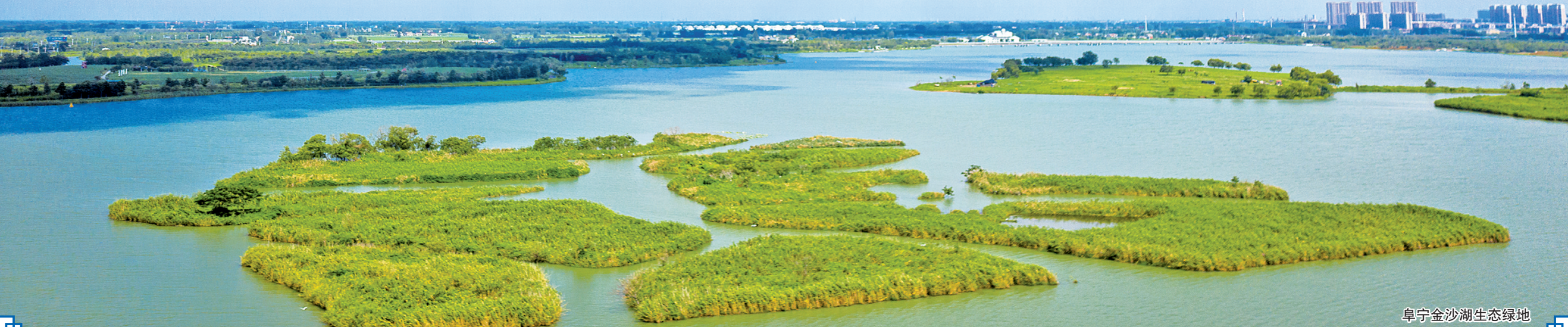
阜宁金沙湖生态绿地

高标准推进招商引资。 投资1.2亿元的球网加工项目建设前期所有行政审批手续办结,正在进行场地平整和交地手续,6月中旬正式开工建设。投资1.1亿元的锅炉结构件项目,正在进行建设之中,预计6月底圈梁全部浇筑结束。