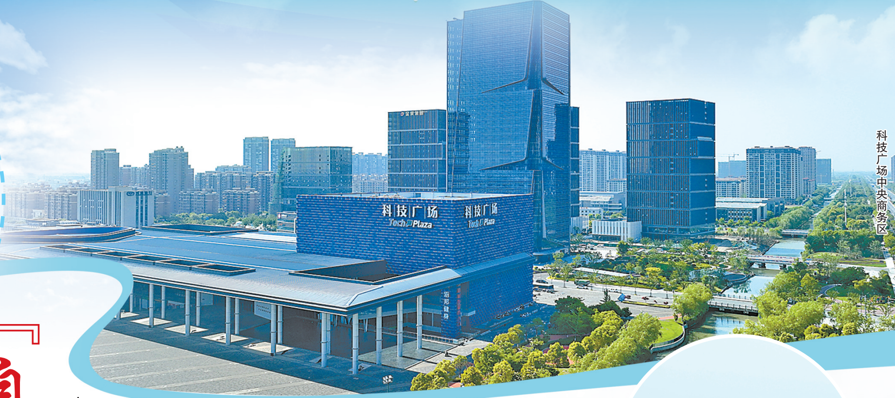
科技广场中央商务区

近年来,盐都区自然资源和规划分局聚焦“两保一优”,聚力“自然都好”,坚持高水平保障发展,严起来保护资源,勇担当化解矛盾,为全区高质量发展提供了强有力的自然资源和规划保障,连续6次获评省自然资源节约集约利用模范区、连续两年获省政府督查激励,2022年度获全省节约集约利用综合考核第一名,2023年1月,获评全国首批自然资源节约集约示范县(市),获省自然资源节约集约利用模范区、土地执法模范区、耕地保护激励区“三满贯”。盐都区自然资源和规划分局被省人社厅、自然资源厅表彰为综合先进集体;局党总支2022年被中共江苏省自然资源厅党组评为“全省自然资源系统先进基层党组织”,2023年被中共盐城市委评为“全市先进基层党组织”。