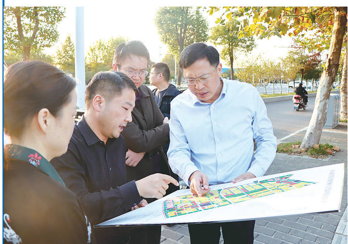
调研项目推进情况