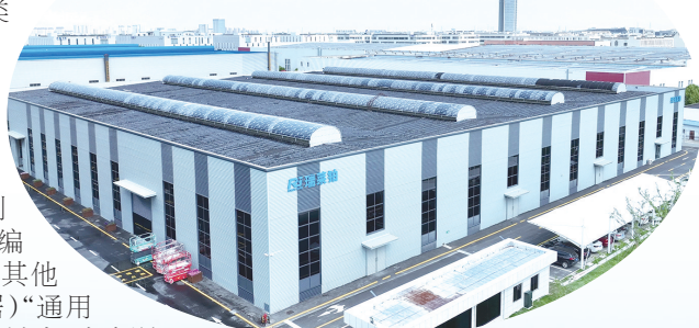
瑞莱船舶标准厂房

注重镇村布局“大写意”。 优化调整镇村布局规划,明确村庄分类和布局,将全区1268个自然村划定规范发展村庄195个、搬迁撤并类村庄303个、其他一般村庄770个。制订2024年村庄规划编制计划并纳入2024年全区城建重点项目,目前已编制村庄规划98个,落实编制单位94个。出台其他非规划发展类村(居)“通用式”规划导则,确保农村地区规划管理全覆盖。