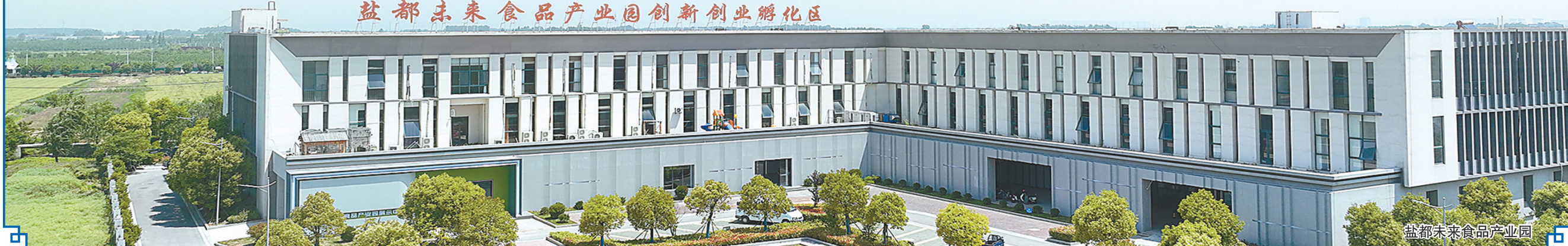
盐都未来食品产业园