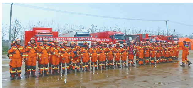
消防扑救实战拉动演练

实施节地增效行动。 全面落实建设用地“增存挂钩”,完善增量安排与存量盘活机制,提升新增建设用地计划指标使用效率。实施工业企业资源集约利用差别化政策,进一步强化“亩产论英雄”导向,激励企业提质增效、转型升级。推广先进节地技术和节地模式,引导“工业上楼”。统筹利用地表、地上和地下空间,推进建设用地立体开发,提高土地利用强度。