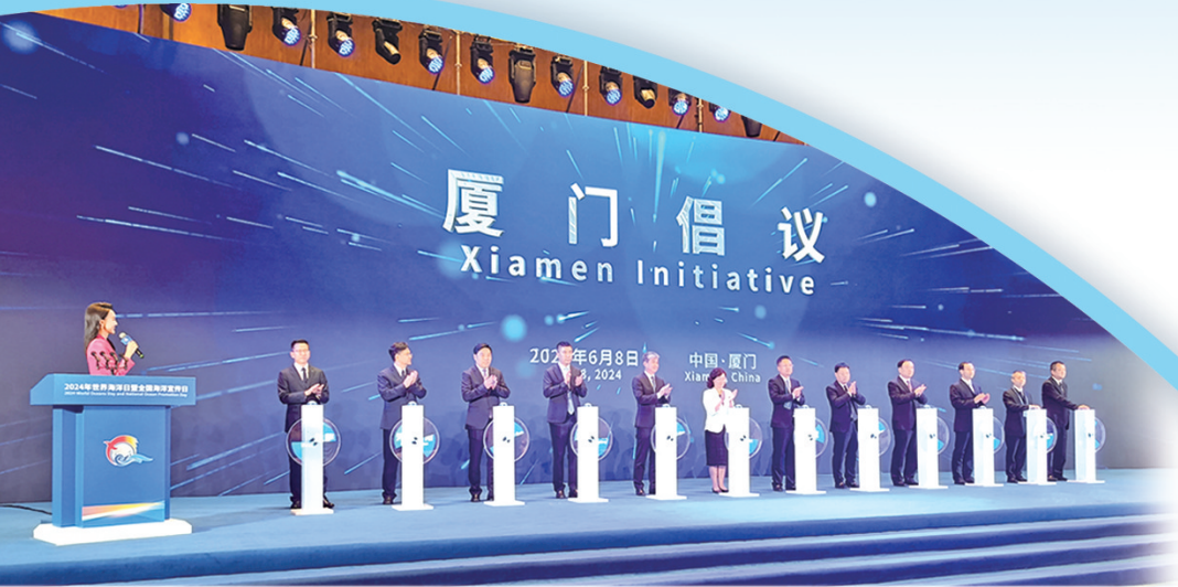
盐城参加“厦门倡议”