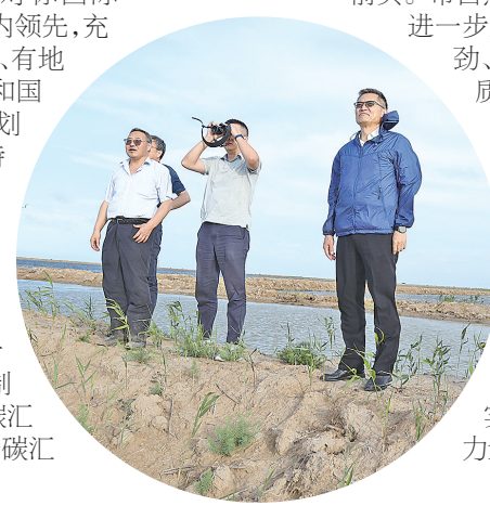
南大团队来盐防治互花米草

潮头登高再击桨,无边胜景在前方。市自然资源和规划局进一步坚定信心、鼓足干劲、勇挑大梁,聚力高质量发展、聚焦高颜值生态,坚定不移推动“两保一优”取得更大成效,为勇当全省发展新质生产力重要阵地“碳路先锋”蓄势赋能,为中国式现代化盐城新实践贡献更多资规力量。