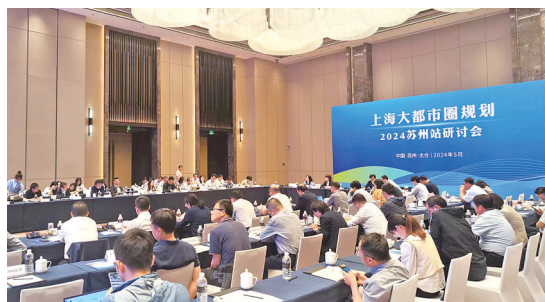
上海大都市圈规划“苏州站”研讨会

5月底,上海大都市圈规划“苏州站”规划研讨会在总体目标上明确了盐城打造上海大都市圈新兴产业基地的发展定位,盐城作为上海大都市圈“产业发展新空间、保障保供大基地、生态休闲大花园”的定位在规划成果中进一步体现。