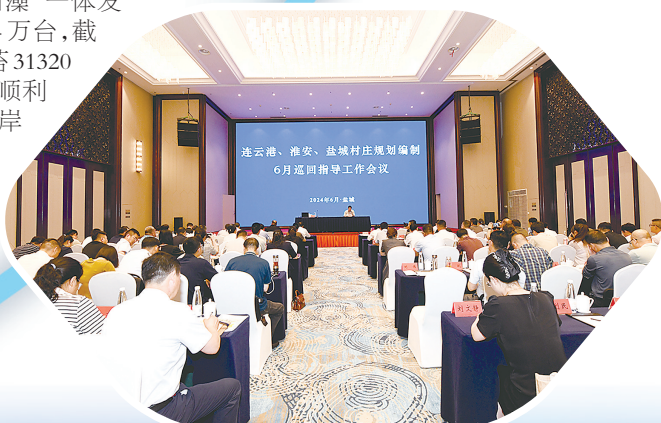
村庄规划工作会议

加强系统修复,守护滨海生态安全。全力推进互花米草治理,累计治理互花米草18.59万亩,规模全国最大。深入实施浒苔绿潮联防联控,坚持源头“控藻”、全程“除藻”、科学“用藻”一体发力,其中压减紫菜养殖筏架4.4万台,截至6月14日,今年累计打捞浒苔31320吨,资源化利用浒苔4904吨。顺利完成中央财政支持的盐城市海岸线生态保护修复项目,修复海域面积15.5平方公里,大陆自然岸线保有率达到43.64%,全省最高,有力推动全省最长海岸线成为最美海岸线。