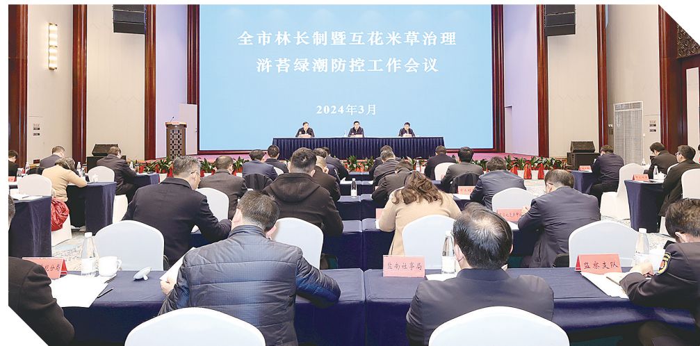
全市林长制暨互花米草治理浒苔绿潮防控工作会议