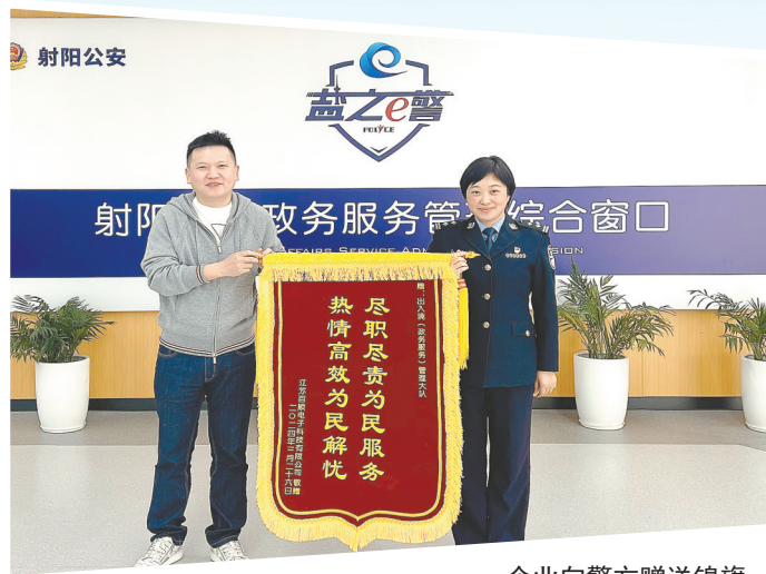
企业向警方赠送锦旗

仲夏暖意浓,“春耕”战果丰。6月20日上午,盐城市公安局召开全市公安机关“盐靖·2024春耕行动”工作成效新闻发布会,通报行动的成果成效。 侦破刑事案件1500余起,抓获违法犯罪嫌疑人2700余人,走访企业4200余家,矛盾纠纷化解率98.8%……“盐靖·2024春耕行动”聚焦矛盾纠纷排查化解、电动车交通安全管理、涉众型金融风险防范化解、严打突出违法犯罪、基层消防安全治理、企业走访服务等8个方面开展攻坚,一项项数据展现了盐城公安的担当作为,解答了人民群众的获得感、幸福感和安全感从何而来。