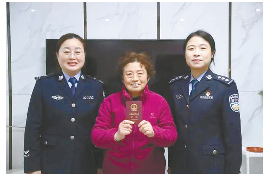
暖心服务换来真诚笑容

幸福生活图景从平安“枫”景来。盐城公安坚持和发展新时代“枫桥经验”,积极探索矛盾纠纷多元化治理的典型模式和经验,创新建立矛盾纠纷首发“及时调”、异地“线上调”、疑难“联动调”、分类“专业调”四调融合机制。行动以来,累计排查矛盾纠纷2.2万余起,攻坚化解突出矛盾86起。