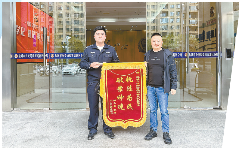
群众为民警送来锦旗

在射阳县公安局出入境窗口,聋哑人夫妇手写点赞纸条;在建湖县公安局出入境窗口,退休劳模送来感谢信;在盐城市公安局交警支队,群众送来按满红手印的联名感谢信……盐城公安推出“预约办”“上门办”“延时办”“便捷办”等方式,推出“周末不打烊”服务,“春耕行动”以来,窗口服务满意度达99.61%。