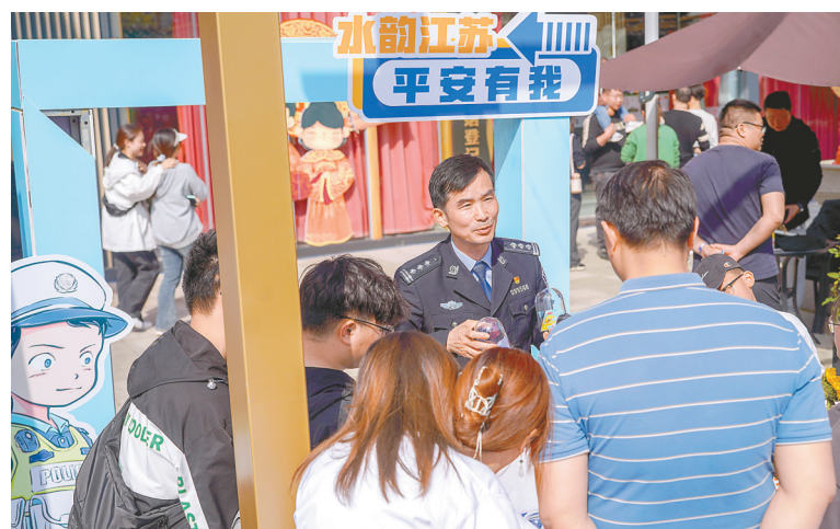
开展“水韵江苏 平安有我”禁毒宣传活动