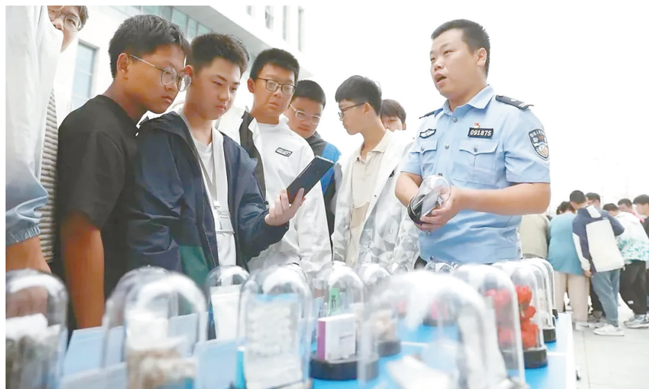
开展禁毒宣传进校园活动

本报讯(吴坚 张腾飞)侦破“部目标2023-475”号跨国制毒案获评“全国禁毒工作十大典型案例”,侦破“部目标2023-379”号涉依托咪酯案件获评“打击依托咪酯犯罪十大典型案例”,专项打击整治经验做法被国家禁毒办推广,吸毒检测率和驾照注销率实现100%……6月21日上午,在第37个“6·26”国际禁毒日来临之际,盐城市公安局召开禁毒工作新闻发布会,通报去年以来打击整治依托咪酯工作成效。