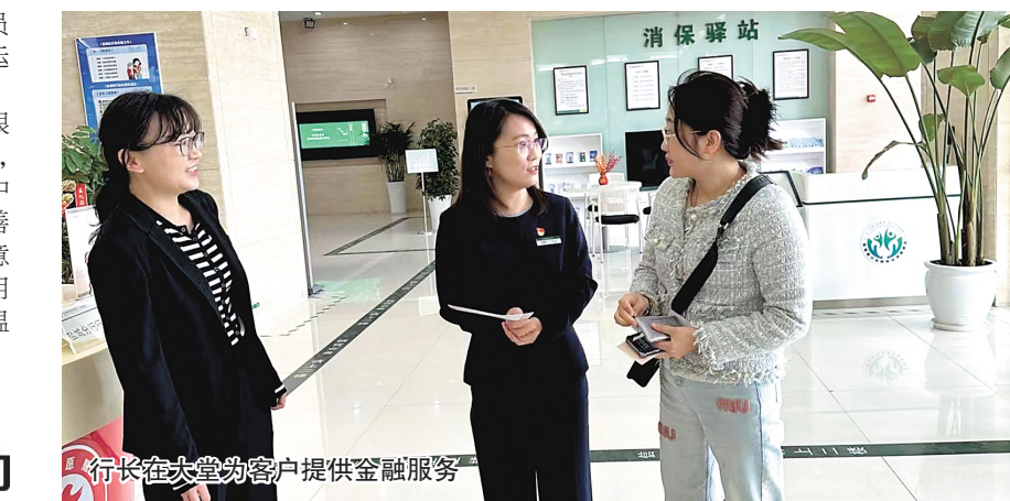
行长在大堂为客户提供金融服务

能机具使用情况,对理财经理、大堂引导员就厅堂服务进行了指导,针对客户服务、运营精细化管理提出了优化意见。 对于“行长值大堂”主题活动,邮储银行盐城分行一直高度重视并持续推进,从客户视角出发,认真践行“以客户为中心”的服务理念,不断优化管理思维、完善服务举措,提高服务水平,提升客户满意度,切实达到了为客户办实事的目的,用实际行动诠释了“有担当、有韧性、有温度”的企业精神。