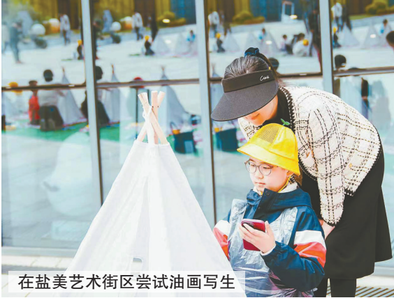
在盐艺术街区尝试油画写生