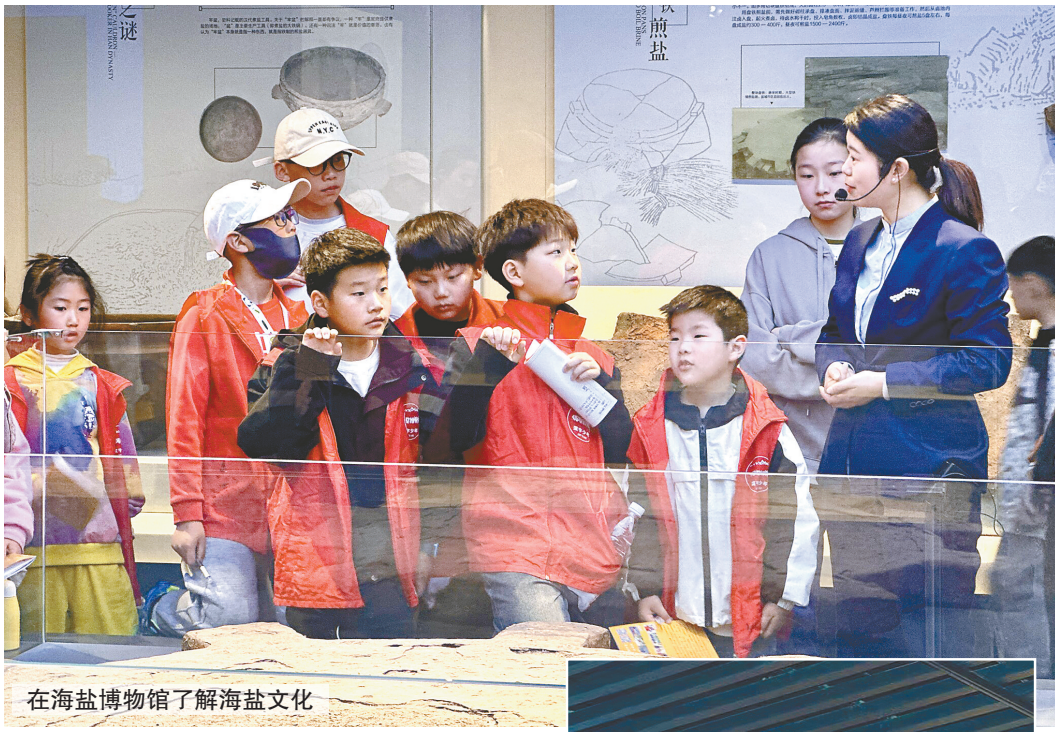
在海盐博物馆了解海盐文化