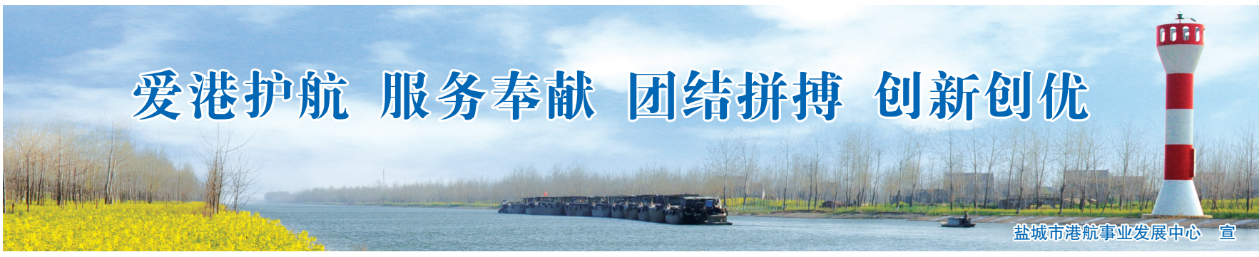
盐城市港航事业发展中心 宣