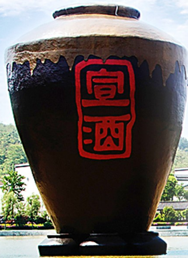
独创徽派酱酒——宣酱