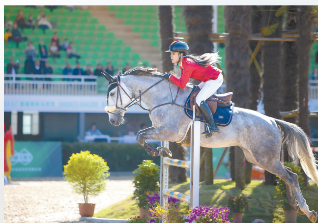
长三角之心·广德马术节暨安徽省第二届马术公开赛