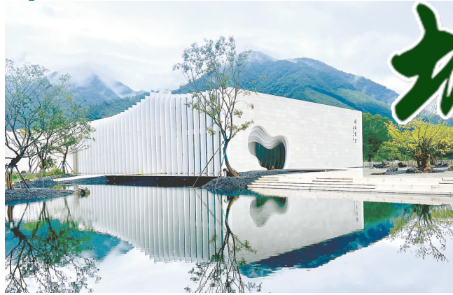
宣纸小镇·国纸客厅