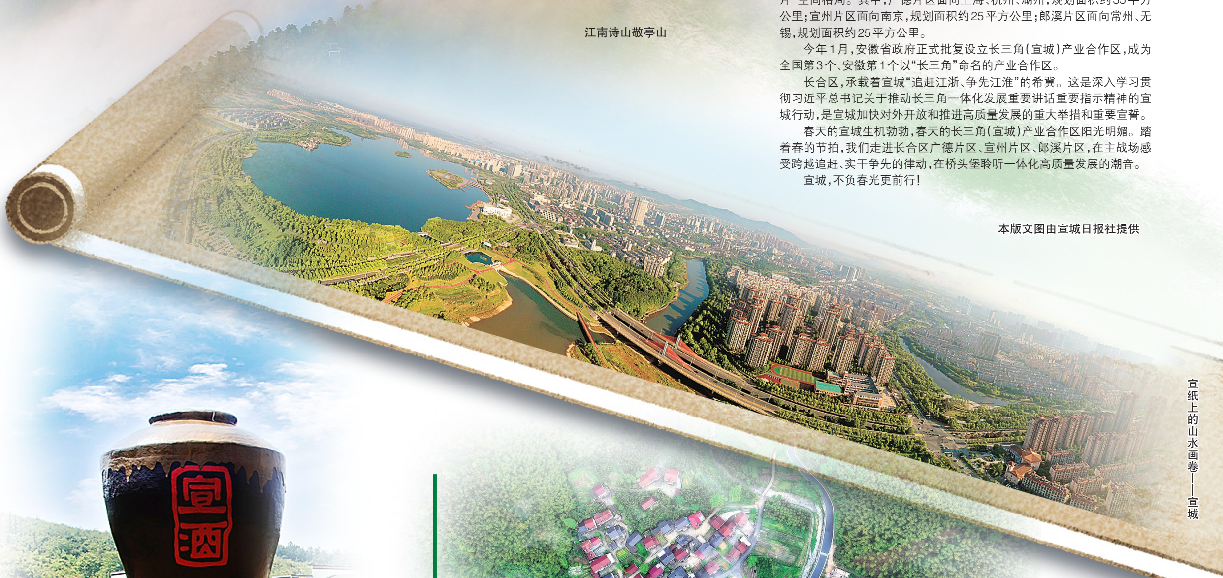
宣纸上的山水画卷——宣城