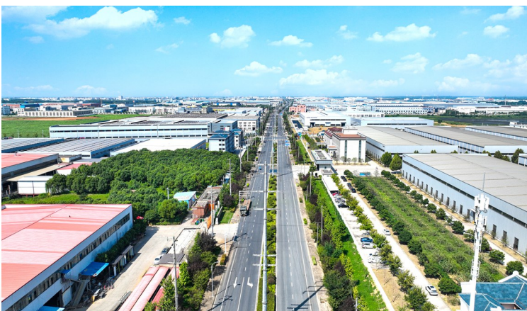
宣城市郎溪经开区