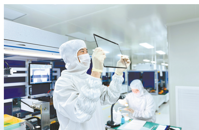
长合区广德片区的安徽威灏光电有限公司生产车间