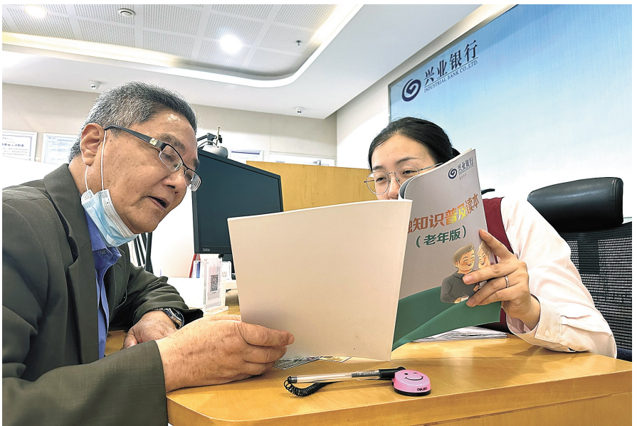
服务专员为老年客户介绍金融知识普及读本。

综合施策,不断完善适老化服务。在适老化服务中,为保障老年人支付服务的知情权和选择权,该行辖内营业网点服务设施配置齐全,尤其老花镜、爱心席位、爱心柜台等适老化服务工具实现全覆盖。同时专门为特殊人群设置服务绿色通道,配备专职服务人员,并根据网点的标准、布局和功能将服务区划分为现金区、非现金区、适老网点专区、客户休息室、沙龙活动室、老年电子银行体验专区、贵宾客户专区等。针对年龄较大或行动不便的老年客户,主动安排专员提供上门金融服务