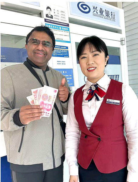
外籍人士对兴业“零钱包”服务表示认可。