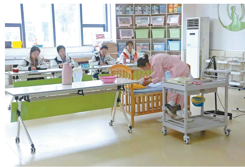
育婴项目职工组竞赛现场。

本报讯(马杰)4月7日至8日,第二届全国乡村振兴职业技能大赛江苏选拔赛(盐城赛区)在江苏省盐城技师学院举行。本次选拔赛由省人力资源社会保障厅主办,盐城技师学院承办,盐城赛区共有育婴和养老护理两个项目。来自江苏省内各设区市的30多名选手同台竞技,争夺国赛“入场