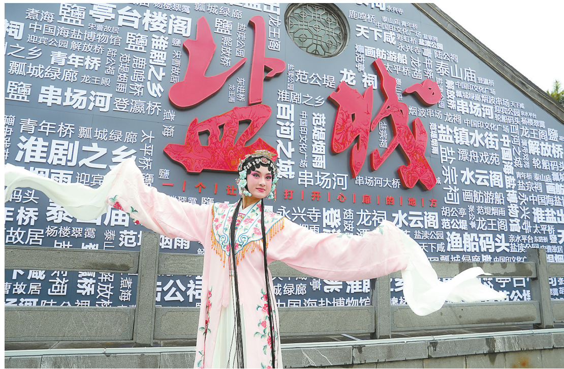
近日,我市各特色文化街区、场馆开展丰富多彩的活动,展示了盐城丰富的人文风貌,让人们感受到这座城市的活力。

产品质量安全县3个。民以食为天,食以安为先。食品安全只有起点、没有终点。接下来,我市将以本次成功实现全覆盖为契机,坚持食品安全“四个最严”要求,进一步增强责任感、紧迫感和使命感,不断夯实食品安全监管工作基础,持续强化食品安全隐患排查治理,全面推进食品安全社会共治,努力在机制创新、智慧监管等方面取得新成效,推动全市食品安全总体水平不断提升,切实增强人民群众的获得感、幸福感、安全感。