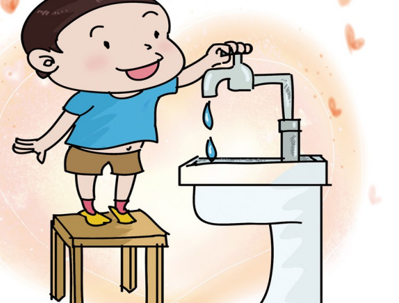
节约用水,从我做起