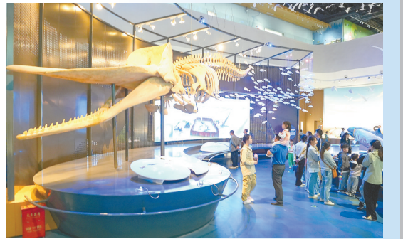
盐湿地博物馆的“鲸奇世界”。