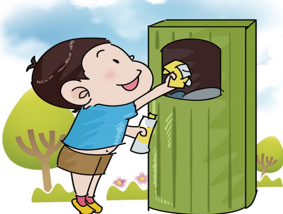
保护环境,从我做起