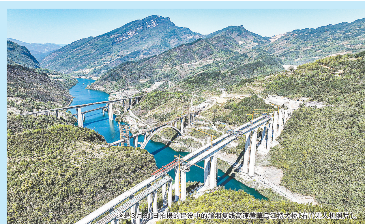
这是3月31日拍摄的建设中的渝湘复线高速黄草乌江特大桥(右)(无人机照片)。