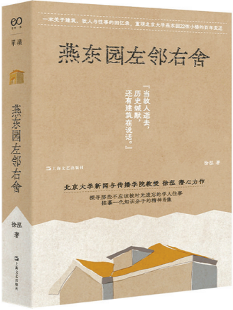
《燕东园左邻右舍》 徐泓著 上海文艺出版社