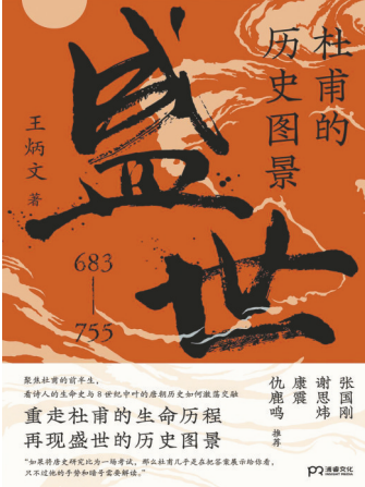
《杜甫的历史图景：盛世》 王炳文著 岳麓书社