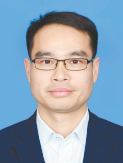
朱 伟 滨海县委常委、县委书记、县监委主任

利用《作风面对面》《民生聚焦》、“码”上监督平台等载体,听民情、集民智、解民忧。今年,将继续把监督的“放大镜”聚焦到群众急难愁盼上,不断推动镇村工程、教育、医疗、物业等专项整治工作取得扎实成果。