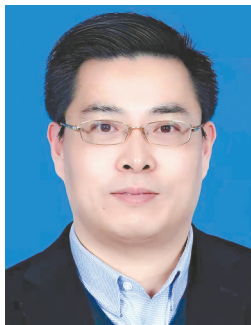
刘海峰 大丰区委常委、区纪委书记、区监委主任

新功”主题活动,在深化内化转化上当标杆。推进政治监督“护航”工程。用好“三个载体”,开展“对账式”监督;聚焦新型工业化等重点工作开展“嵌入式”监督。推进系统反腐“巡航”工程。突出“重拳斩链”,强化“集团作战”,深化整治重点领域腐败;用活“四个平台”,深化“四类教育”,持续擦亮响水廉洁文化名片。推进正风肃纪“助航”工程。专项整治违规吃喝、不作为、乱作为问题;突出“关键少数”“八小时外”监督,贯通党性教育、纪法教育、警示教育和家风教育,促进党员干部廉而有为。推进重大课题“导航”工程。建立“群众点题、部门答题、纪委跟进”机制,室组镇联动,大力整治教育、就业、医疗等民生领域突出问题。推进铁军标兵“远航”工程。打造“清廉卫士·灌河铁军”党建品牌,开展“讲政治、强本领、树形象”专题活动,坚决防治“灯下黑”。