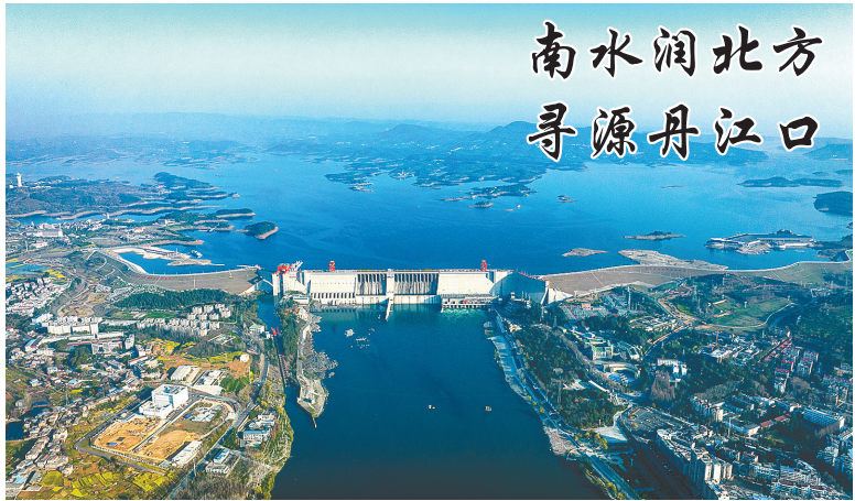
南水润北方 寻源丹江口

有“亚洲第一大人工湖”之称的丹江口水库，是南水北调中线工程的水源区。2014年12月12日，南水北调中线工程全面通水；9年来，累计调水量已超过600亿立方米，豫冀津京四省市直接受益人口超过1.08亿人。监测数据显示，丹江口水库常年稳定保持在Ⅱ类及以上水质。图为3月22日拍摄的丹江口水库(无人机照片)。