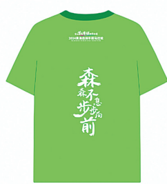
半程马拉松参赛服