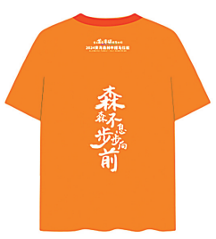
迷你、亲子跑参赛服