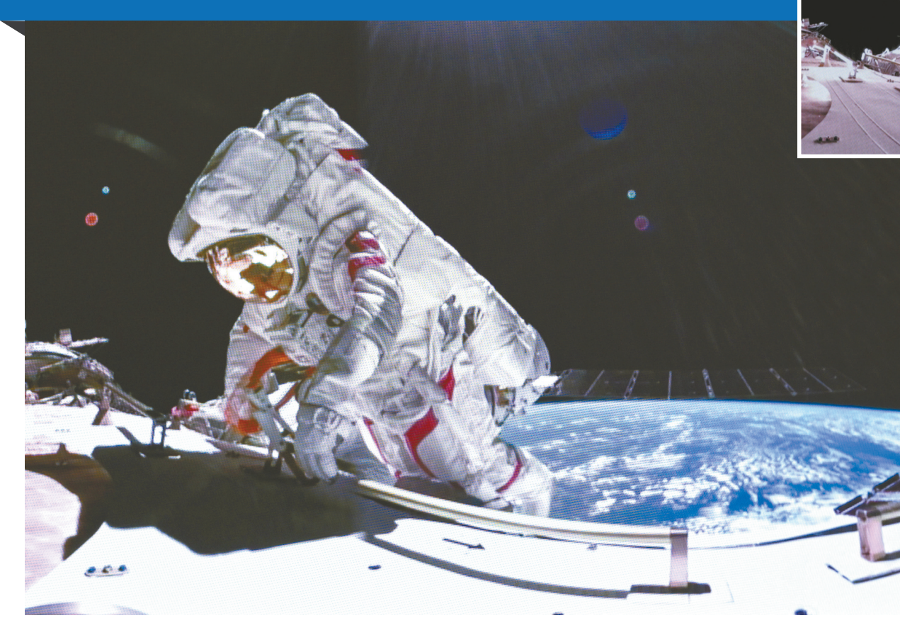
3月2日,在北京航天飞行控制中心拍摄的神舟十七号航天员汤洪波在空间站组合体舱外作业。