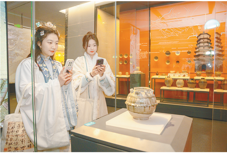
游客打卡精品文物展览