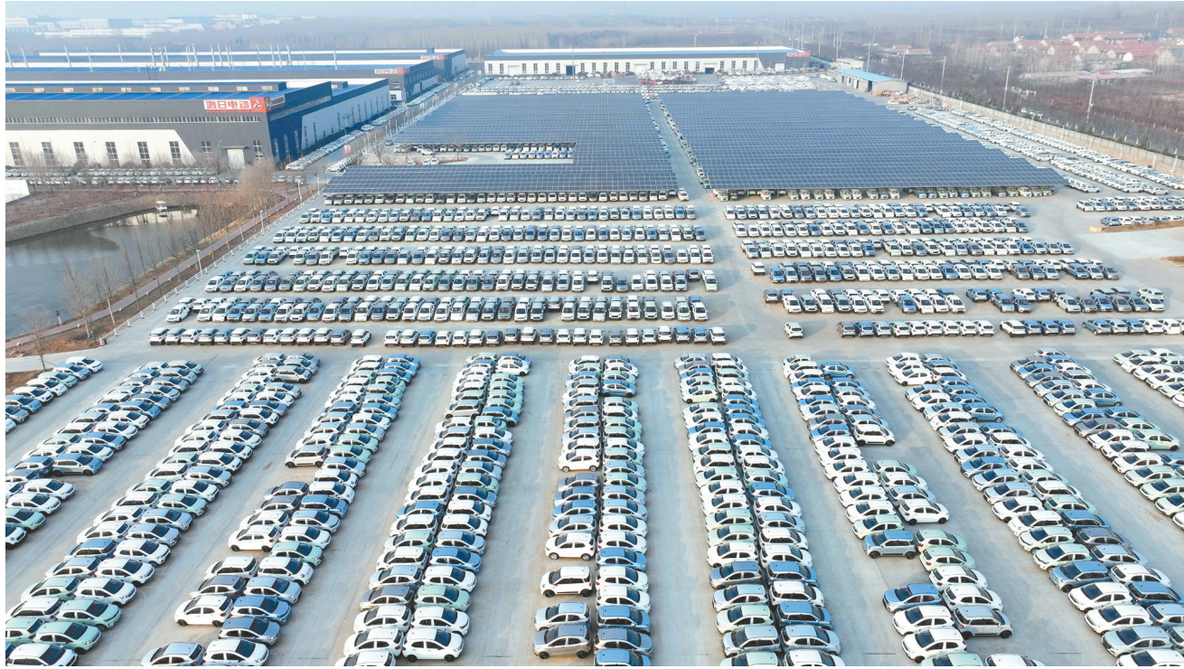
在山东日照鸿日新能源汽车有限公司,刚下线的新能源汽车停放在厂区货场,准备发往河南、河北等地(1月12日摄)。