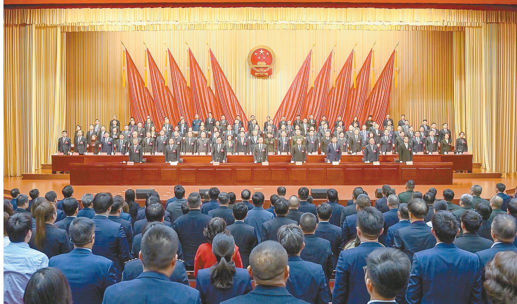
1月18日下午，市九届人大四次会议圆满完成各项议程后胜利闭幕。记者 邵野乔 摄