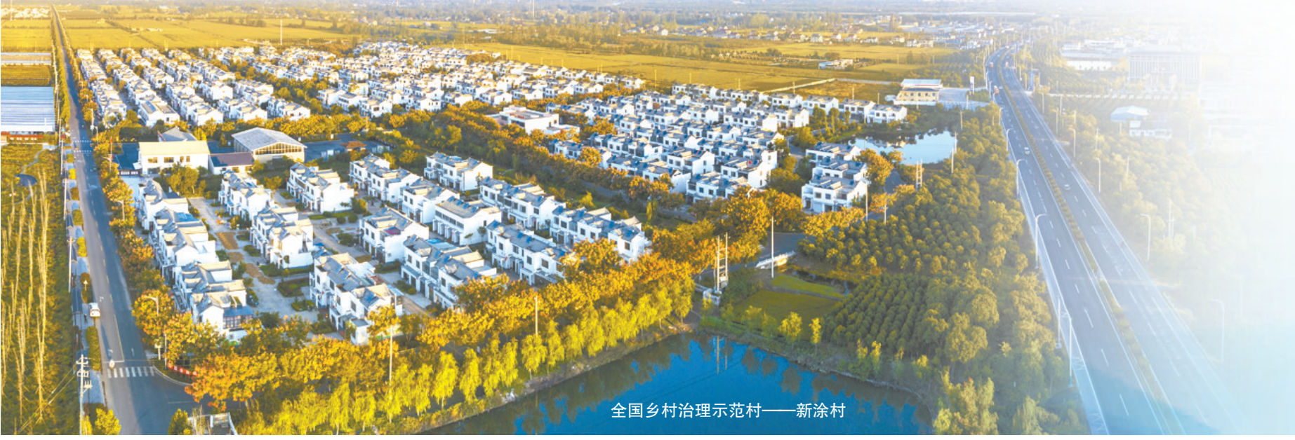
全国乡村治理示范村——新涂村