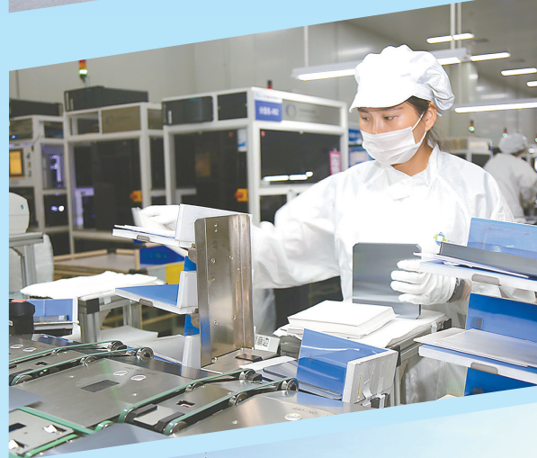
协鑫硅片项目生产场景