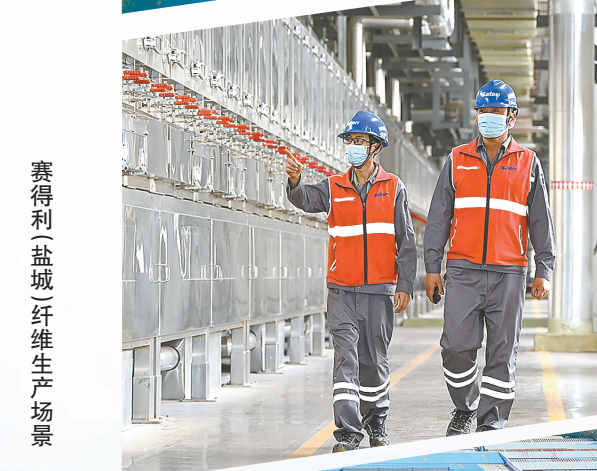
赛得利(盐城)纤维生产场景