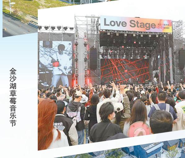
金沙湖草莓音乐节