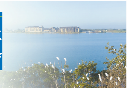
金沙湖城市湿地公园

产业发展势头向好。阜宁先后举办北京高质量发展恳谈会、5·18经贸洽谈会、上海产业招商推介会和环保新材料创新论坛等活动。工业开票销售同比增长6.8%,其中,新能源、新型纤维材料产业分别增长11.1%、18.6%,环保滤料产业园荣获中国产业用纺织品行业智能制造示范园区。完成建筑业总产值733亿元,继续保持全市第一。