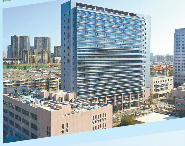
阜宁县人民医院二期工程