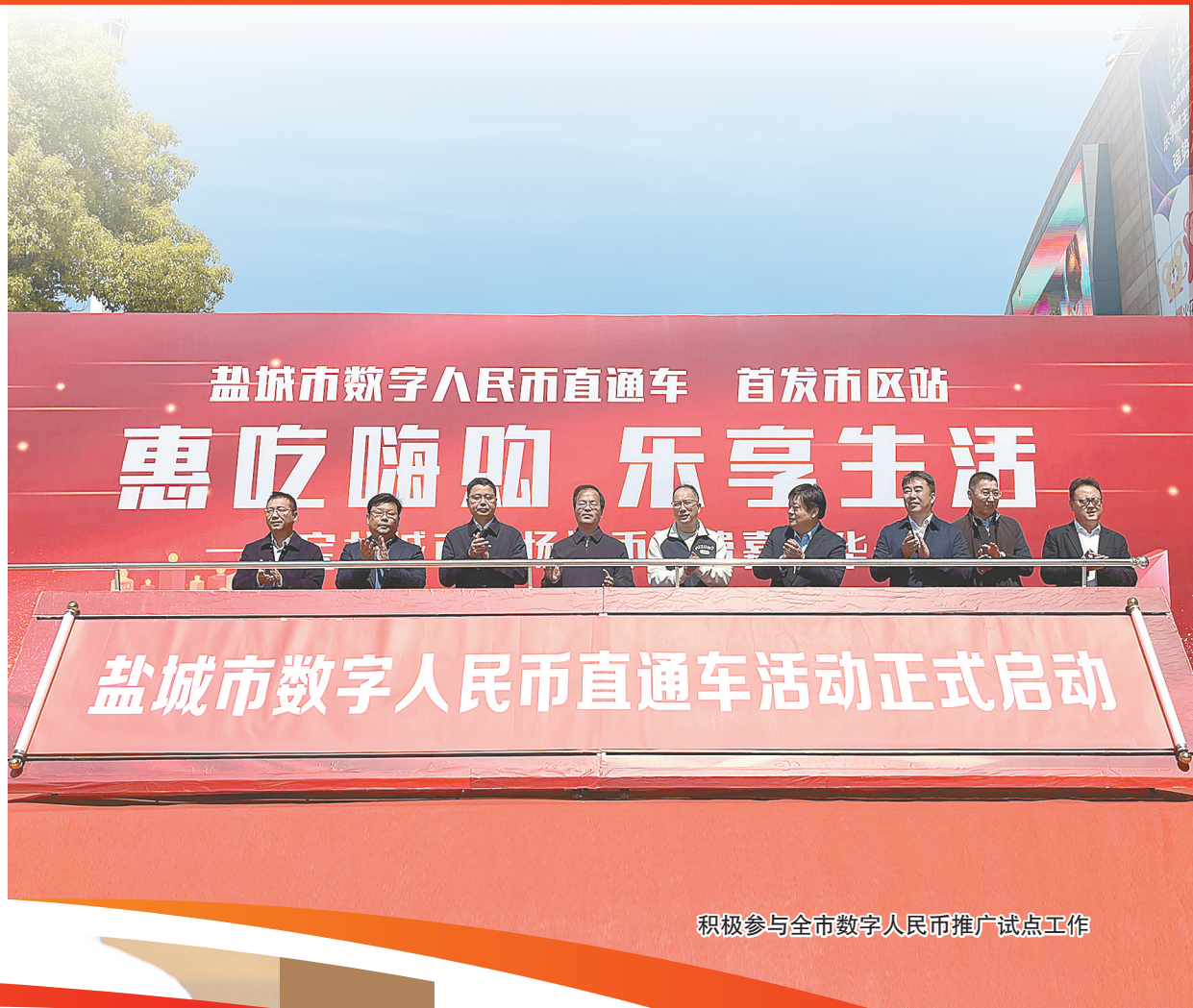
积极参与全市数字人民币推广试点工作