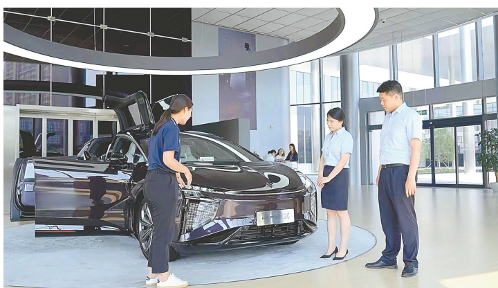
支持盐城汽车产业发展

做实普惠金融。成立普惠金融执行委员会,聚焦小微企业,建立绿色通道,提升服务效率,持续创新“种植e贷”等普惠特色产品。2023年末,该行普惠贷款增速60.83%,列系统内全省前列。