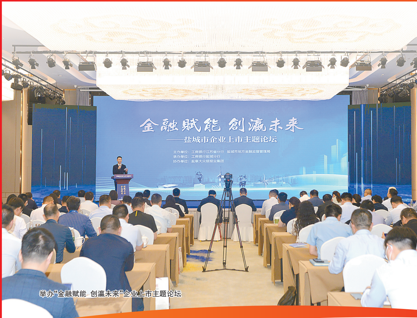
举办“金融赋能 创赢未来”企业上市主题论坛