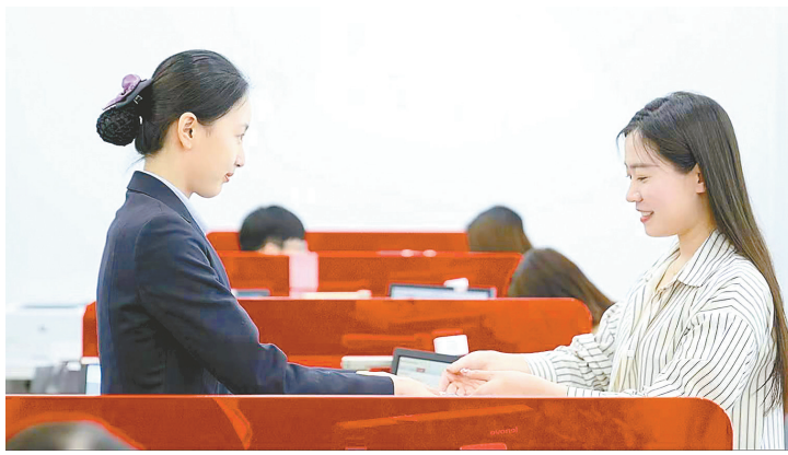
为客户提供优质金融服务