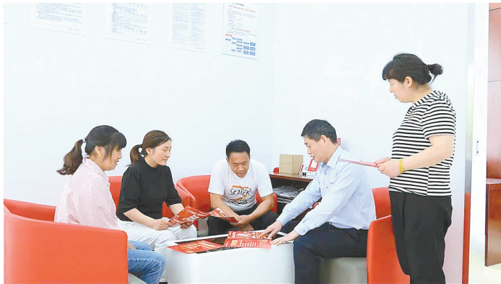
深入基层一线了解金融需求