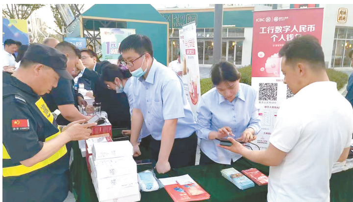
现场指导市民使用数字人民币