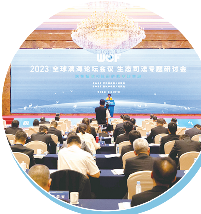
成功举办全球滨海论坛会议生态司法专题研讨会,为打造司法守护湿地生态的中国样本贡献盐城智慧。

深入践行“两山”理念,成功举办全球滨海论坛会议生态司法研讨会,沿海11家高级法院齐聚盐城,共建滨海湿地一体化司法保护机制。围绕市委“四个三”工作布局,出台22项举措全力保障绿色低碳发展示范区建设。审结环境资源类案件371件,持续擦亮“国际湿地、沿海绿城”金名片。参照市人大常委会制定的《黄海湿地保护条例》,审结的2则湿地保护案例入选全国典型。协调15个部门出台生态损害赔偿办法,与中华环保联合会等组织共建生态修复机制,开展补植复绿、增殖放流等活动,推进黄海湿地碳汇能力修复基地建设,着力构建生态保护“大格局”。环资审判工作获盐调研的最高法院杨临萍副院长充分肯定。