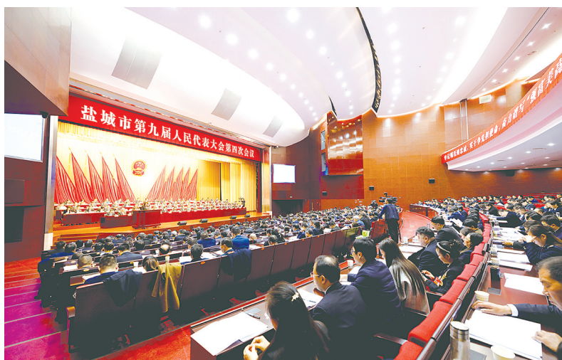
盐城市第九届人民代表大会四次会议现场。