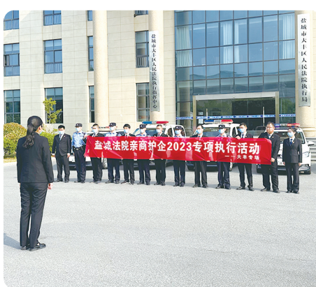
在首个“盐城企业家日”,两级法院开展惠民暖企集中执行行动,切实维护广大群众和民营企业合法权益。

常态化开展凌晨执行、假日执行,组织“小标的大民生”等专项执行活动670场次,执结案件6.5万件,到位金额83.7亿元,全力打通实现公平正义的“最后一公里”。全面推行司法网拍,为当事人节约佣金近6亿元。在房产拍卖中创新引入住房公积金贷款机制,有效提升资产溢价率的做法被省法院推广。强化执行威慑,司法拘留拘留1586人次,限制高消费3.2万人次。在市委政法委及公安、检察等部门支持下,出台打击拒执犯罪工作指引,依法追究41名被执行人刑事责任,强化生效裁判必须履行的鲜明导向,经验做法获最高法院肯定。