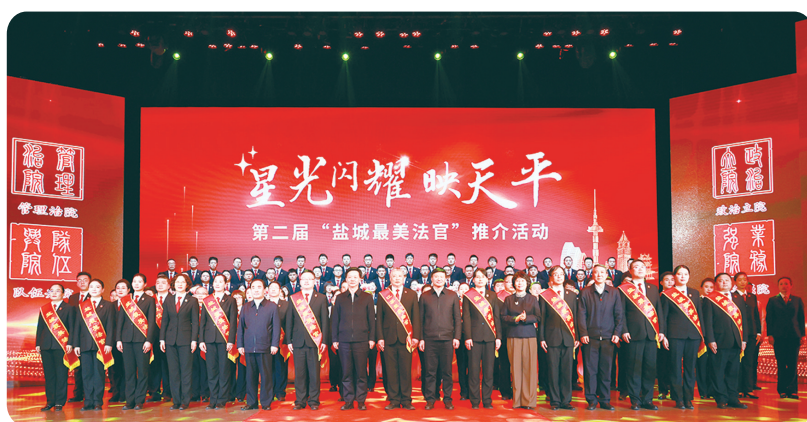
深入推进“五比一争”活动,加强“关键少数”引领示范,院庭长人均办案数继续保持全省前三;开展向先进典型学习活动,择优遴选47名员额法官,激励干警对标奋进。高标准建设青年干警研究会,实施“三大技能”等培训项目72个,构建立体化人才

培育体系。大兴调查研究,成功承办省法学会民法学研究会年会,与苏州大学共建担保案例研究基地,1篇论文获全国法院学术讨论会二等奖,42篇调研成果在《最高人民法院报》《人民司法》等国家级载体上刊发。