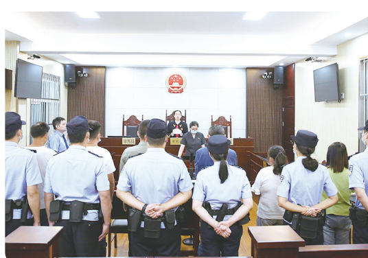
严惩“盗抢骗”“食药环”等犯罪,全力促进社会安定、人民安宁。

一审审结刑事案件5398件8715人,助力我市创成全国首批社会治安防控体系建设示范城市。积极参与净网、断卡、拔钉等行动,审结网络犯罪、“帮信”犯罪案件1437件,全面净化网络空间。常态化推进扫黑除恶,2则案例获省扫黑办表彰,“法赋未来·丰帆启航”机制获评全省法院一等奖。积极参与“问题楼盘”处置,协同化解房企融资展期、引资续建、复工交房等纠纷133件,全力保交楼。加强监察执法与刑事司法衔接,审结贪污贿赂犯罪案件54件54人,其中省管干部1人、县处级干部6人。