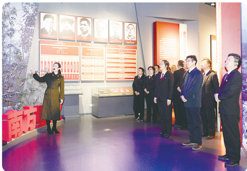
市中院党组理论学习中心组赴新四军纪念馆开展现场研学,推动主题教育走深走实。

编者按:2023年,全市法院坚持以习近平新时代中国特色社会主义思想为指导,深入学习贯彻党的二十大精神,坚持“公正与效率”主题,充分发挥审判职能,全面强化政治自觉、法治自觉、行动自觉,牢记嘱托、感恩奋进,全力服务中国式现代化盐城新实践。本版与您一起回顾2023年全市法院工作的“十大亮点”。