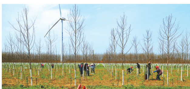
全民义务植树造林

2023年盐城市自然资源和规划局荣获“全国绿化模范单位”称号。全市共完成新造成片林1.47万亩,占省定任务的115%,其中新增造林5423亩,是省定任务的3倍。