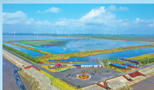
条子泥720高潮位栖息地

2023年第二届江苏省“最美生态保护修复案例”我市2个案例入选,获评数量全省最多。分别是:世界遗产名录——中国黄(渤)海候鸟栖息地条子泥湿地生态保护修复,最美生态河——盐城蟒蛇河生态修复。