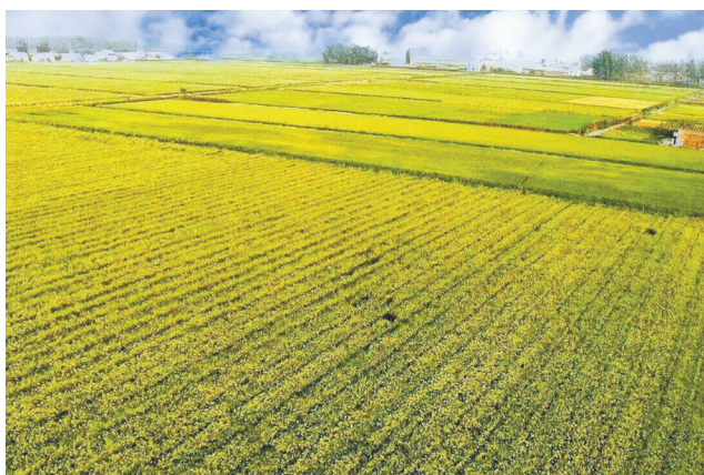
滨海县天场镇天场等6个村土地整治项目

2023年,响水县、盐都区、阜宁县、大丰区4个县(区)耕地保护工作获省自然资源厅激励表彰;盐都区秦南镇、大丰区南阳镇、响水县响水镇、滨海县八巨镇、阜宁县古河镇、射阳县四明镇、建湖县建阳镇、东台市溱港镇、亭湖区盐东镇等9个镇耕地保护工作获省级200万元资金奖励;县、镇获奖数量均为全省最多。