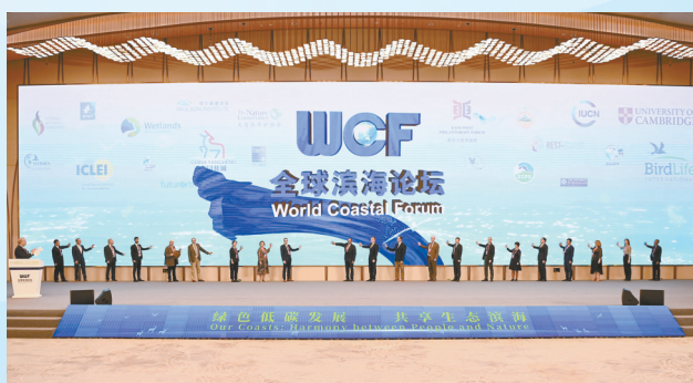
发布全球滨海论坛伙伴关系倡议

2023全球滨海论坛会议于9月25日—27日在我市隆重召开。在市委、市政府的坚强领导下,盐城市自然资源和规划局主动请战、靠前担当,积极与部省层面衔接沟通,全力做好会议筹备、活动组织、服务保障等各项工作。成立10个工作组,全程服务省内外自然资源条线320多名来盐嘉宾。认真策划《国际湿地 沿海绿城》主题画册,全面展示我市高质量发展成效和高水平保护成果。