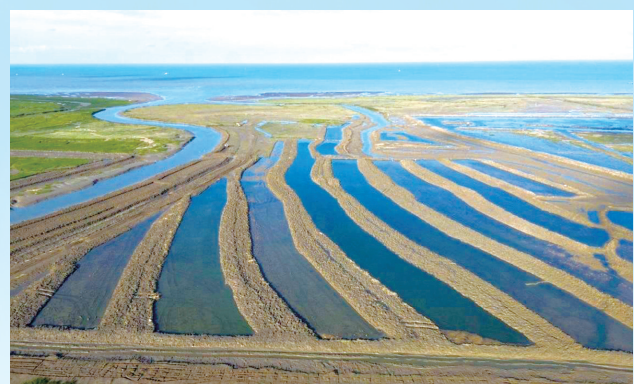
大丰区“刈割+围淹”治理现场

根据国家和省部署要求,全市沿海地区共摸排互花米草23.29万亩,省里下达我市治理任务20.4万亩,占到全省的三分之二、全国的五分之一。我市坚持“因地制宜、有序推进、系统修复、长效治理”的原则,稳妥推进互花米草治理,2023年累计除治互花米草面积11.84万亩,占省下任务的111.1%。