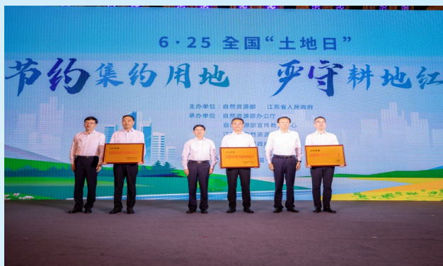
江苏省自然资源节约集约利用综合评价颁奖会

2023年,我市首次获评江苏省自然资源节约集约利用模范市,并受到省政府督查激励表彰。阜宁县获评省级模范县,受到国务院督查激励表彰;盐都区、东台市入选全国自然资源节约集约利用示范县(市)创建名单;响水县获得省级进步奖;盐都区、建湖县获评省级资金奖励地区。