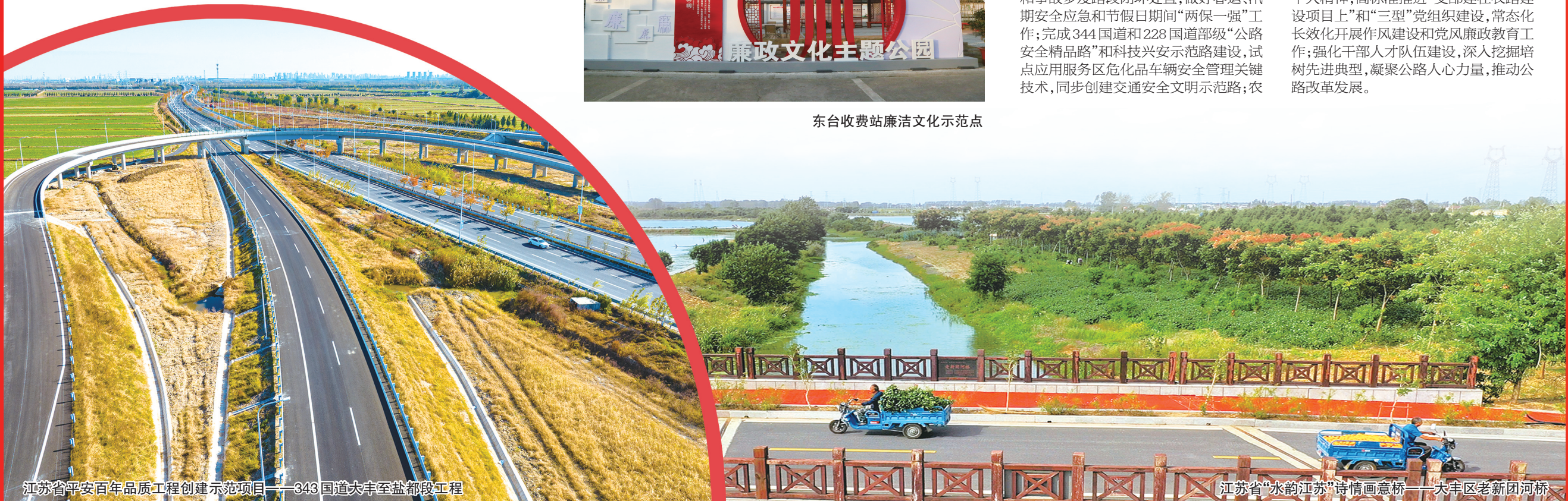
江苏省平安百年品质工程创建示范项目——343国道大丰至盐都段工程