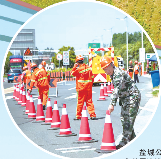
盐城公路防汛应急处置演练