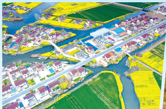
江苏省“平安放心路”样板路——盐都区大陈线