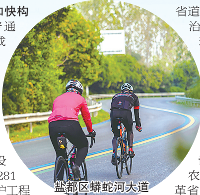
盐都区蟒蛇河大道

公路路网体系加快构建。 2023年全市普通国道公路建设完成投资61.53亿元,盐丰快速通道二期工程已建成,352省道东台西段、348省道射阳段开工建设。全市农村公路建设完成投资12.4亿元,完成道路建设369公里,改造危桥281座,实施安全生命防护工程2553公里。