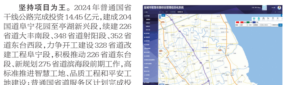
盐城市智慧农路综合管理信息化系统

去岁已展千重锦,今朝更进百尺竿。2024年,盐城市公路事业发展中心将坚决扛起“争当表率、争做示范、走在前列”光荣使命,以“敢为、敢闯、敢干、敢首创”的担当,狠抓落实,加压奋进,推动公路养护管理、服务体系、行业治理、本质安全等工作质效整体提升。