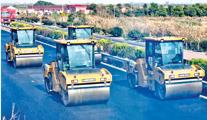
养护大中修工程无人集群施工作业

公路转型升级乘“数”而上。 以交通运输部交调数字化试点任务“盐城市干线公路多源数据融合感知与智能应用项目”、盐城公路综合管理平台为抓手,数字化运用涵盖公路“建管养服”全周期;利用桥梁健康监测、桥梁防撞系统、交通事件感知系统、轻量化智慧巡查系统,实现交通状态智能感知、预警和快速处置,提升公路本质安全水平。