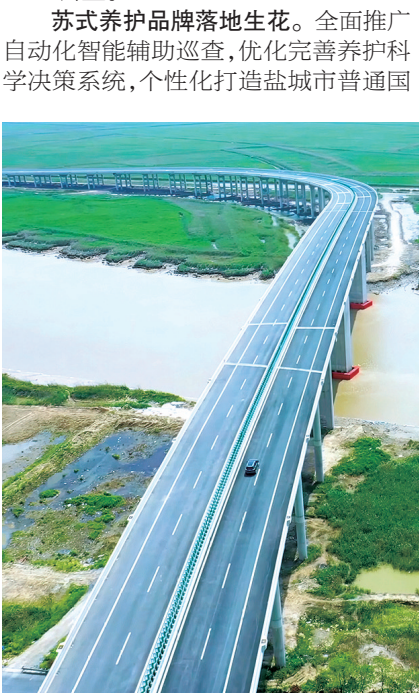
江苏省“水韵江苏”十大最美乡村桥、致富小康桥——射阳县黄沙港大桥

突出党建引领。 深入学习贯彻习近平新时代中国特色社会主义思想,高标准推进“支部建在农路建设项目上”和“三型”党组织建设,常态化长效化开展作风建设和党风廉政教育工作;强化干部人才队伍建设,深入挖掘培树先进典型,凝聚公路人心力量,推动公路改革发展。