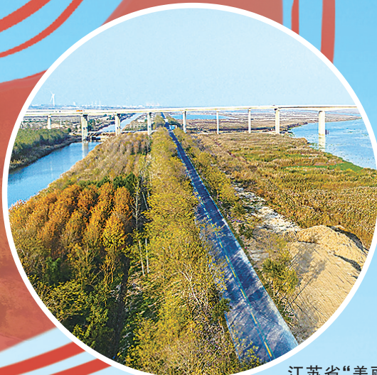
江苏省“美丽农村路”样板路——射阳县海堤公路