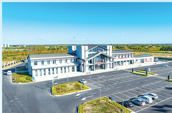
暖心服务“司机之家”——228国道黄尖服务区