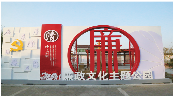
东台收费站廉洁文化示范点

去岁已展千重锦,今朝更进百尺竿。2024年,盐城市公路事业发展中心将坚决扛起“争当表率、争做示范、走在前列”光荣使命,以“敢为、敢闯、敢干、敢首创”的担当,狠抓落实,加压奋进,推动公路养护管理、服务体系、行业治理、本质安全等工作质效整体提升。