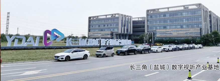
长三角(盐城)数字视听产业基地