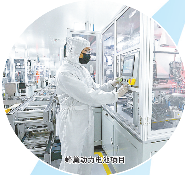
蜂巢动力电池项目

殷殷嘱托、厚望如山,使命光荣、步伐坚定。围绕贯彻习近平总书记重要讲话重要指示精神,聚焦高质量发展首要任务,市委全会谋划推进“四个三”工作布局,强调扎实推进“三大转化”:要把机遇优势转化为发展胜势、把产业方略转化为强市支撑、把关键变量转化为最大增量,在发挥机遇优势、提升发展实力上实干争先,努力创造盐城精彩。