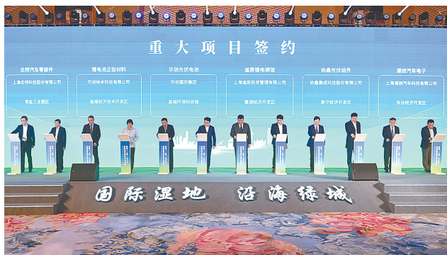
盐城(上海)长三角高质量发展合作恳谈会签约现场