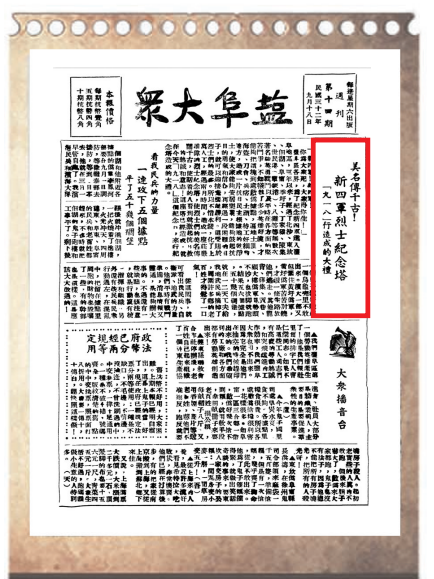
1943年9月18日《盐阜大众》报刊登《新四军烈士纪念馆“九一八”行造成的大礼》。