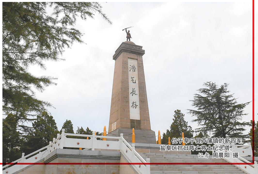
位于阜宁县芦蒲镇的新四军盐阜区抗日阵亡将士纪念馆。