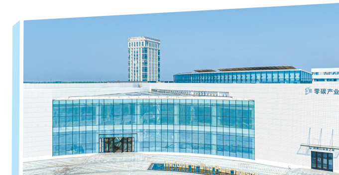
射阳零碳产业研究院