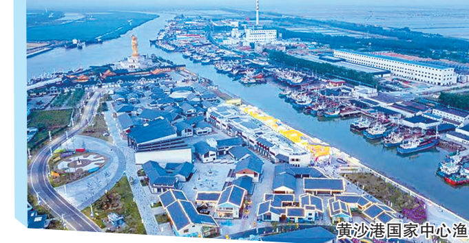
黄沙港国家中心渔港