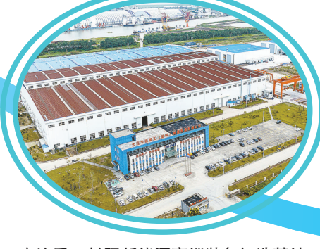
大连重工射阳新能源高端装备制造基地