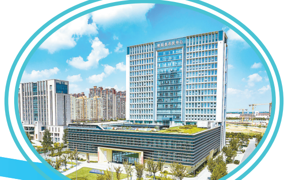
全国人民满意公务员集体——射阳县行政审批局