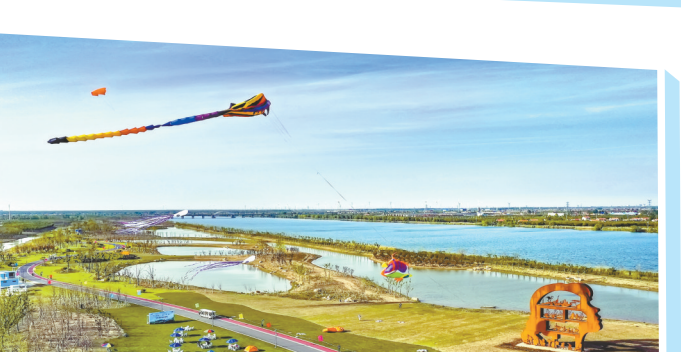
日月岛康养旅游度假区