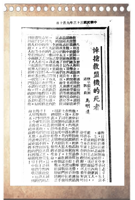
《盐阜报》1944年9月10日刊发了盐阜独立团通讯员的文章《悼抢救盟机的死者》。

传承红色基因,加快绿色崛起。盐城发挥“天蓝地绿基因红”的优势,积极探索滨海区域保护与绿色低碳发展路径,推进中国式现代化盐城新实践,为全球生态治理和人与自然和谐共生贡献力量,在双向奔赴中续写新的国际友好故事。